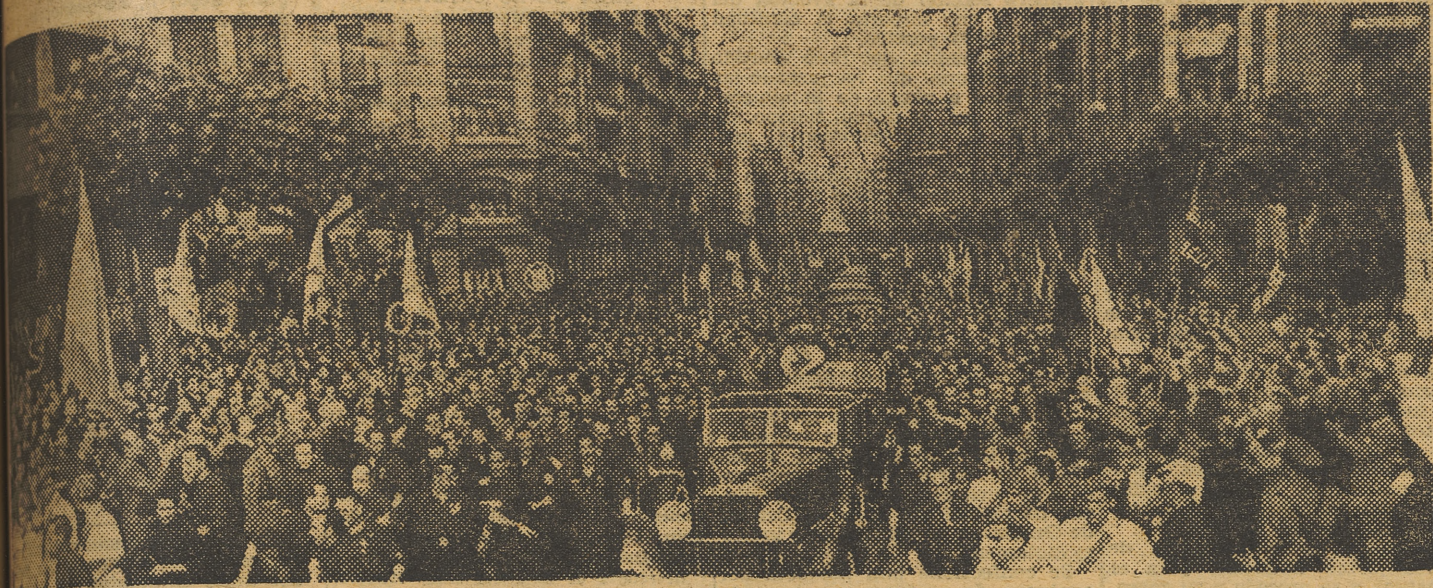
Los productores bilbaínos, después de la concentración que se efectuó ante el Caudillo, rodean con entusiasmo el coche de éste, para expresarle su adhesión.