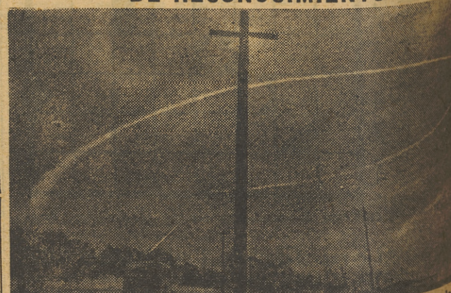
El avión que ha salido de un aeropuerto del alto Norte, del que en el cielo dibujada la estela de la trayectoria recorrida