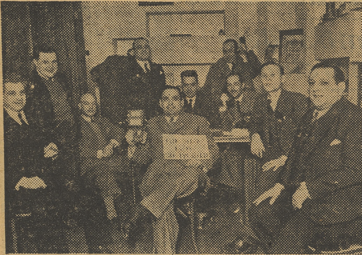
Comisión de la falla de la calle San Vicente y Olympia

TEMPERATURAS EXTREMAS EN LA REGION. —Máxima de 15 en Alcantarilla y mínima de 13,2 en Calumocha.