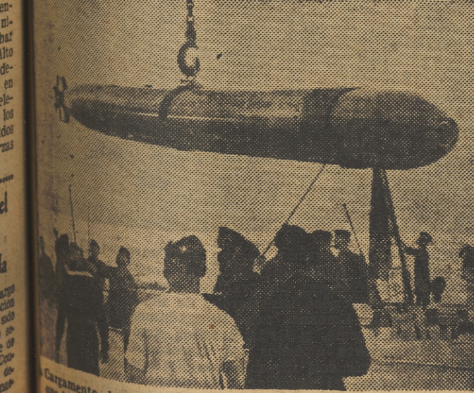
Cargamento de torpedos en las lanchas rápidas alemanas que luchan contra la navegación soviética en el mar Negro