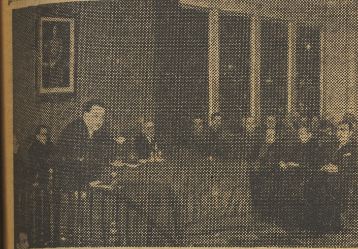
En un momento del acto de ayer en la Universidad