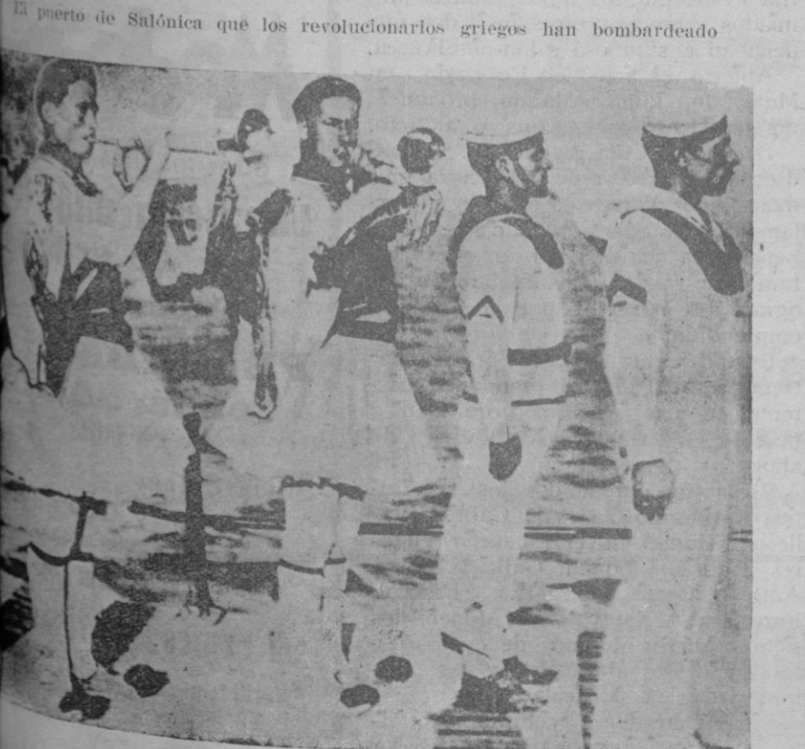
El puerto de Salónica que los revolucionarios griegos han bombardeado Soldados del regimiento de "evzones" y marinos griegos