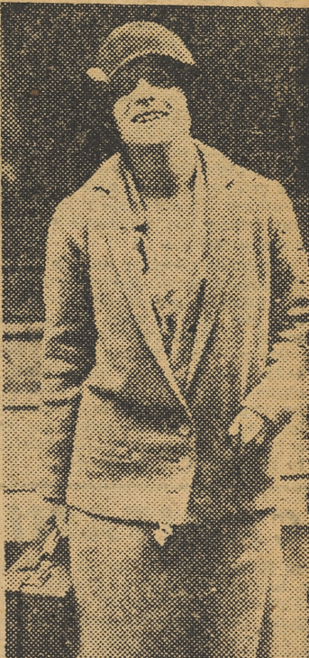
Miss Ellen Wilkinson, que ha sido elegida presidente del partido laborista británico