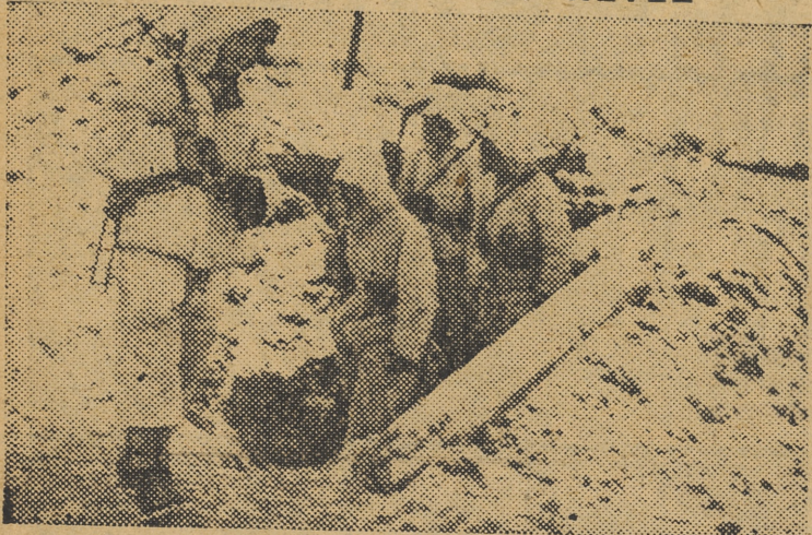
Un fortín instalado por los alemanes en el sector de Nevel, en el frente del Este.