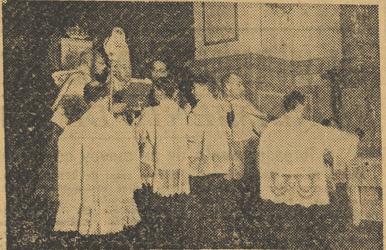
Consagración del altar dedicado al Purísimo Corazón de María, en la que ofició el Rvdmo. Obispo de Barcelona