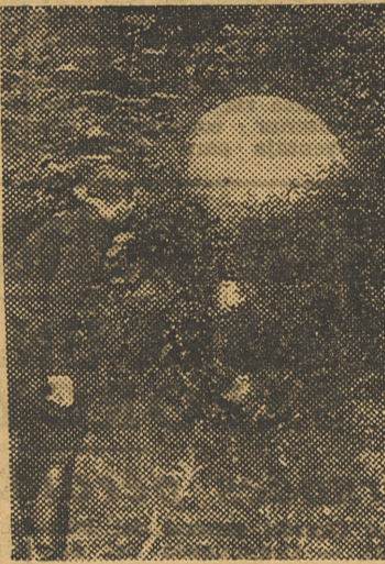
Con objeto de destruir las cosechas, bosques, etc., la aviación aliada lanza sobre Alemania globos, a los cuales van sujetas botellas de líquidos inflamables