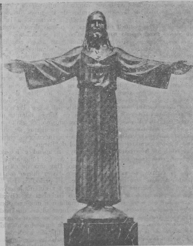
La estatua del Sagrado Corazón de Jesús, en bronce, mide ocho metros, que fué inaugurada el domingo en Barcelona en la cumbre del Tibidabo

Y terminó diciendo: —Acción Popular Catalana te dice en este momento: ¡Presente y adelante!