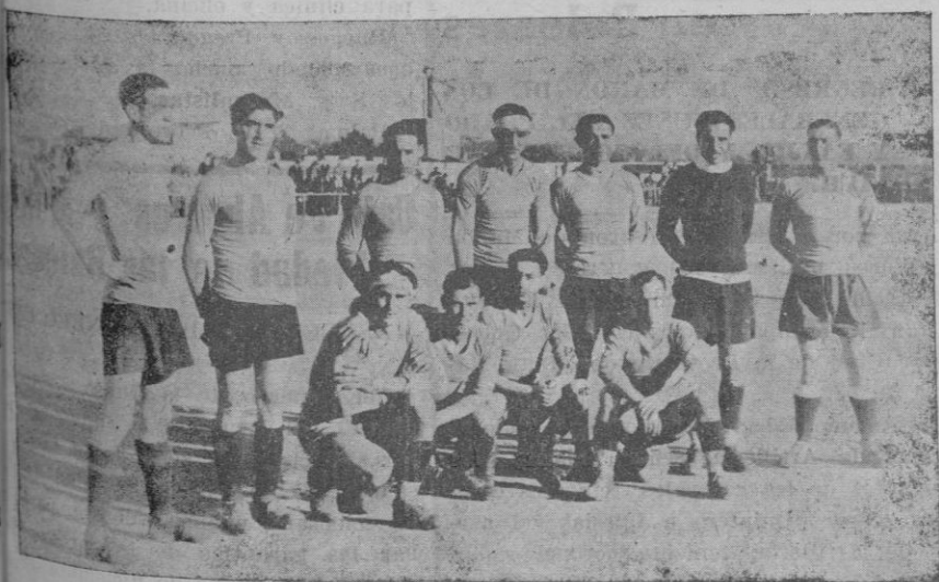
La selección que el domingo se enfrentó al Constanca en el campo del Balears

Formamos el Gobierno de coalición — dijo después — del cual actúa y se mueve con las dificultades inherentes a su composición. Nuestro programa político es: primero, la liquidación del movimiento revolucionario,