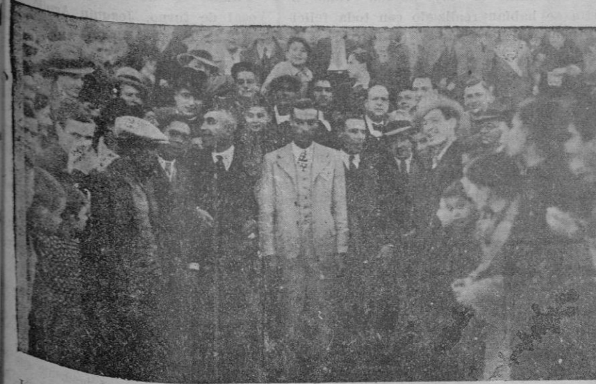
Los Sres. Llabrés, Rullán (Colomina) y Miquel después de serles entregadas por el Presidente de la Federación de Fútbol las medallas concedidas por dicho organismo