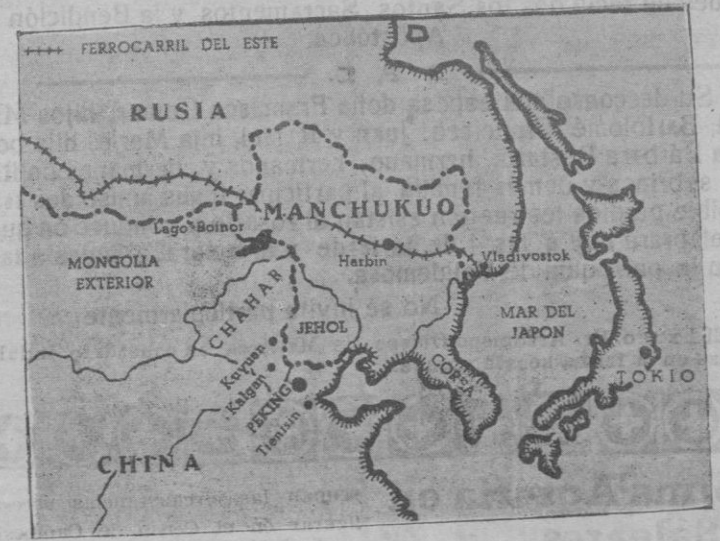
Mapa de la Manchuria, Mongolia y China. Se ve el Lago Baikal, Kuygan y Kalgan, sitios donde los manchurianos han luchado contra mongoles y chinos