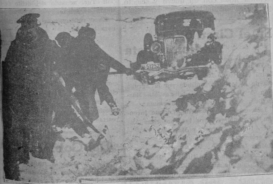
El automóvil del Gobernador de Madrid que al acudir el lunes a Montejo de la Sierra se vió bloqueado por la nieve