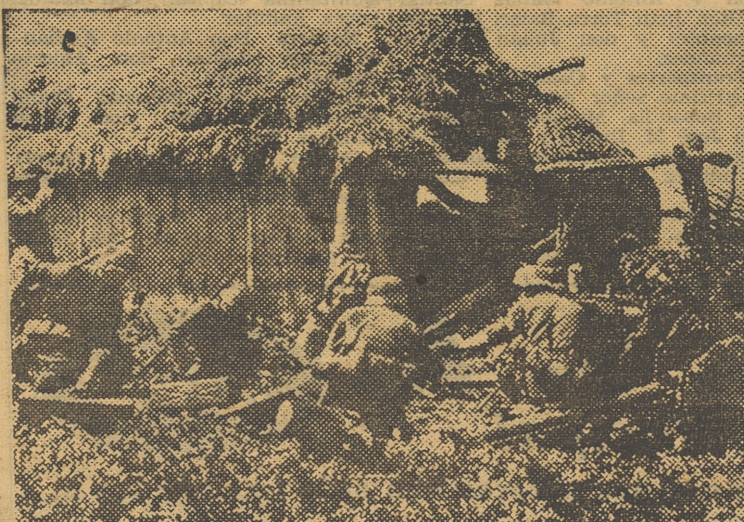
La artillería alemana anti-tanque, ocupa posiciones detrás de las casas de un pueblo para responder al contraataque soviético.