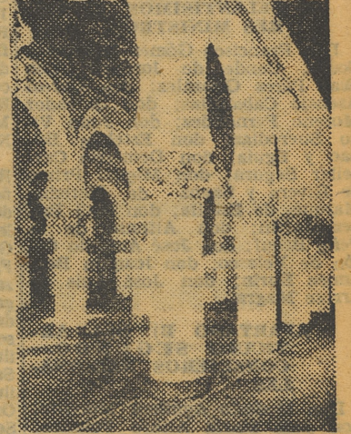
Interior de la sinagoga de Santa María la Blanca, de Toledo