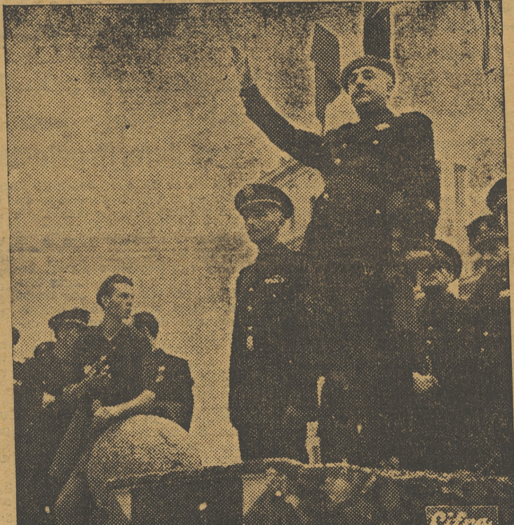
El Caudillo y Jefe Nacional de la Falange preside los actos que el sábado se celebraron en El Escorial para clausurar el II Consejo Nacional del Frente de Juventudes

La confluencia de este pensamiento con la trabazón ineludible de la jerarquía, termina de trazar uno de los rasgos más acusados del perfil falangista. "La razón del jefe no han de dársela ni quitársela la aprobación de sus inferiores sino la de sus superiores." Esa es la verdadera, la fecunda disciplina.