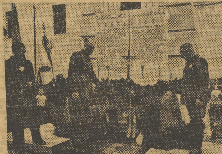
El Capitán General y el Gobernador Civil depositan una corona de flores en el Monumento de los Caídos

El Jefe provincial del Movimiento, visiblemente emocionado por el caluroso recibimiento, entregó a las milicias locales los banderines «José Crespo» y «Andrés Antich».