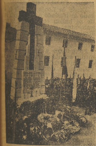
El Monumento a los Caídos

A partir de las 8'30 de la mañana fueron acudiendo a la plaza Mayor, rigurosamente uniformados, las Milicias locales, las Falanges del Frente de Juventudes y las camaradas de la Sección Femenina. En la Jefatura local, situada en dicha plaza, se reunieron todas las Jerarquías y frente a la misma formaron las distintas or-