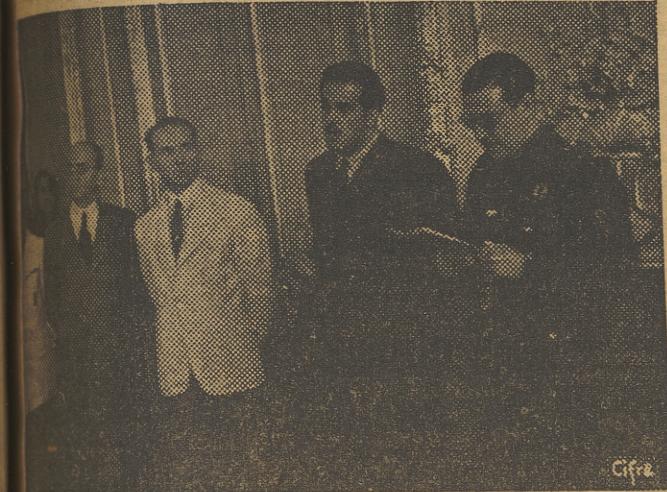
Como acto inaugural de la I Asamblea de Funcionarios de la Dirección de Estadísticas, los asambleístas son recibidos por el Ministro de Trabajo, camarada Girón.

LA ASAMBLEA DE FUNCIONARIOS DE LA DIRECCION DE ESTADISTICAS