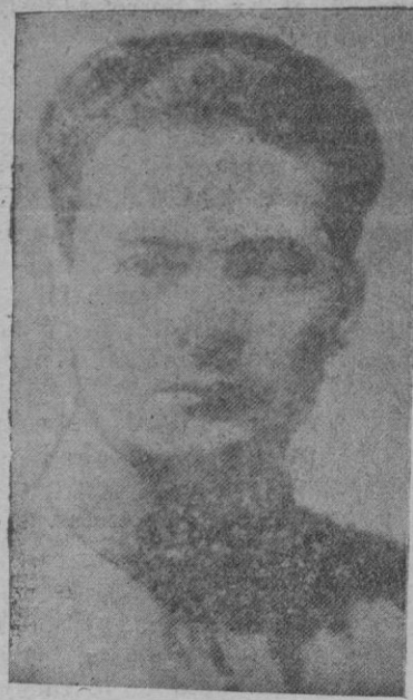
El general José Félix Estigarribia, jefe de las fuerzas paraguayas victoriosas, a quien ya se le llama el "Napoleón" del Chaco