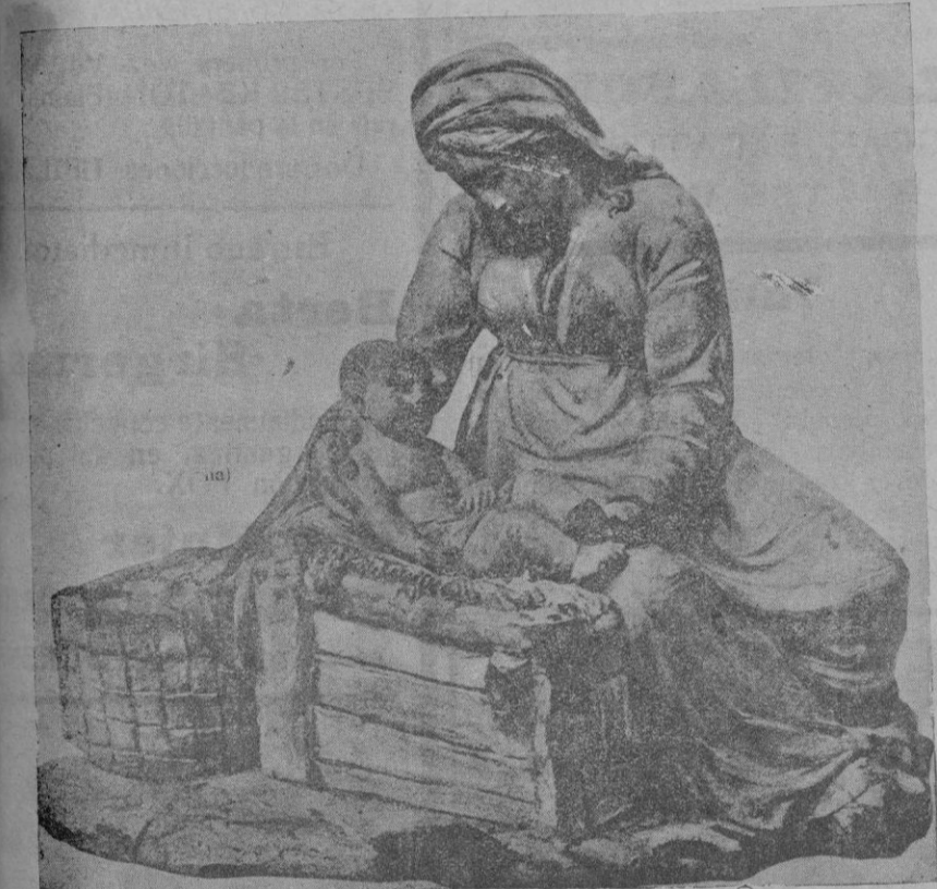
La Virgen y el Niño. Principios del siglo XIX, del Museo de Arte de Cataluña

LA ALMUDAINA de hoy consta de doce páginas