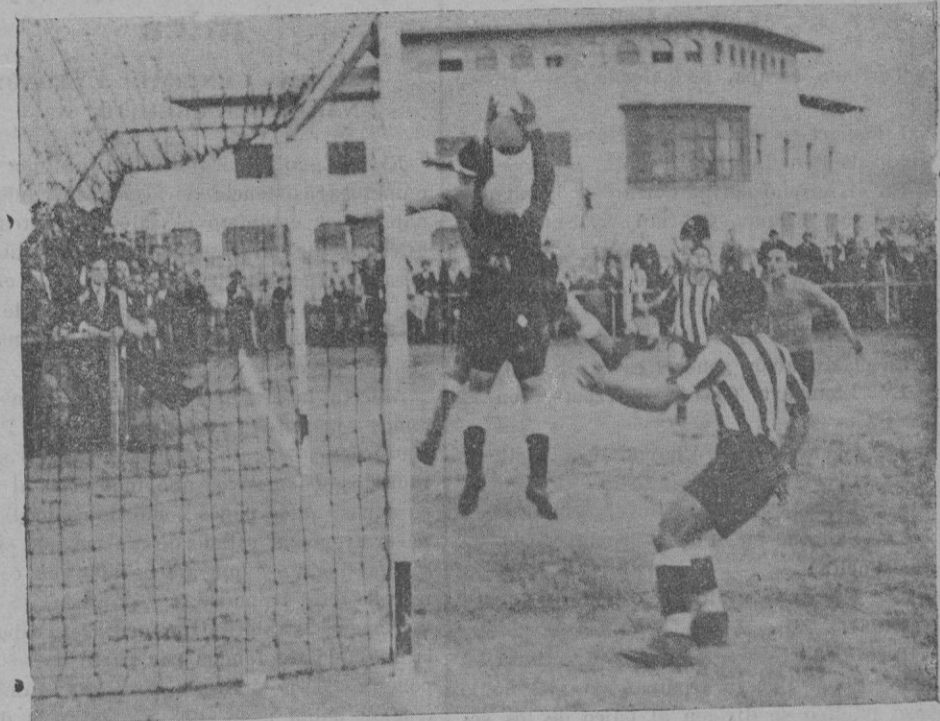
Del partido Athletic-Mediterráneo. — Pericás efectúa un buen blocaje a un centro de Sampol evitando el remate de Jaume