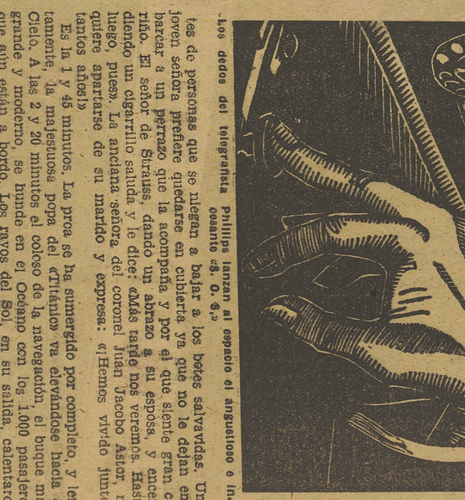
Los dedos del telegrafista Phillips lanzan al espacio el angustioso e incesante «S. O. S.»

El capitán Smith, dió orden de bajar los botes salvavidas. En este momento, el agua invadió el compartimiento de los fogones. La mayor parte del pasaje aún no se había dado cuenta de que el «Titánico» se hundía velozmente. La situación empeoraba por minutos. El telegrafista Phillips lanzaba al espacio su angustioso e incesante «S. O. S.»