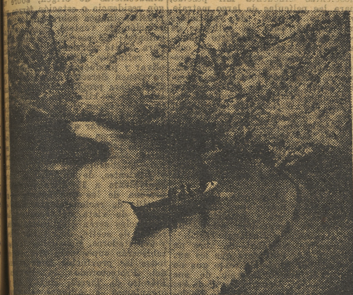
Uno de los motivos más populares del Japón es el de los cerezos en flor. Cuando llega la época de la floración todos los japoneses hacen excursiones a la campiña, para admirar el admirable paisaje. Aquí vemos una plantación de cerezos bordeando el río Kaji.

Son un pueblo imaginativo, amante de la naturaleza y de la poesía