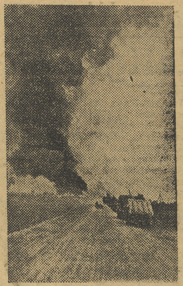
Las columnas avanzan por la carretera de Kalinin a Moscú, en dirección a un pueblo incendiado por los rojos en su retirada

La Jefatura provincial del Movimiento convoca a todos los valencianos para que, sin pérdida de tiempo, entreguen su donativo para la División Azul. Ningún valenciano, en la medida de sus recursos, debe faltar a este llamamiento