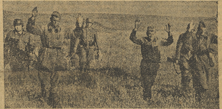
Soldados comunistas se rinden a las avanzadas alemanas