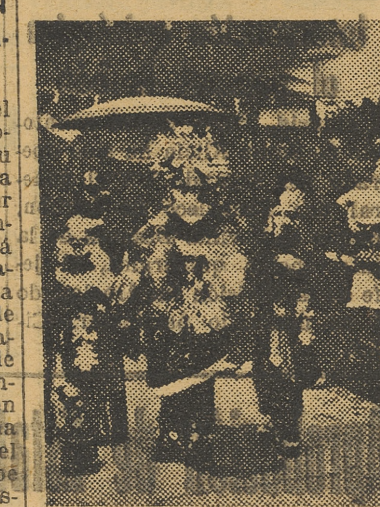
La fiesta de las «Geishas» en Kioto. La tradición y el renombre de las «Geishas» ha llegado hasta los últimos rincones del mundo. Un kimono como este que se ve en la fotografía puede muy bien valer unas 10.000 pesetas.