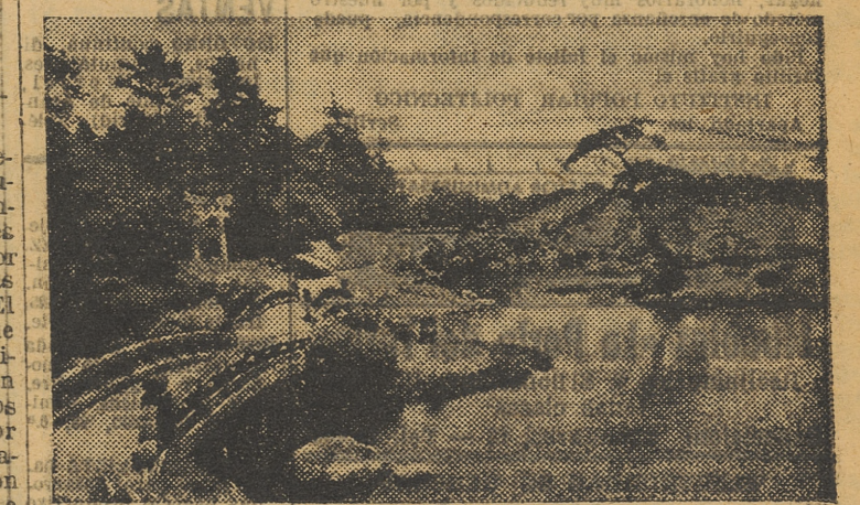
El paisaje japonés es uno de los más admirables del mundo. Doce parques nacionales hay en Japón, para conservar estas bellezas. Un aspecto del jardín de Seicho, en el parque Suizenji de Kioto.

Los japoneses sufrían de la opinión, que afirmaba la inferioridad de la raza amarilla, y todos sus esfuerzos fueron encaminados a lograr la paridad de las razas. Hoy se creen los superiores, y si las potencias occidentales les cierran los mercados de Asia, recuerdan muy bien de qué modo ese mismo Occidente, por medio del comodoro Perry, supo abrir los suyos propios al comercio mundial.