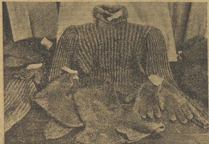
Equipo completo de invierno que la Sección Femenina de Barcelona confecciona para la División Azul. Consta de jersey, pasamontañas, guantes y calcetines de lana.