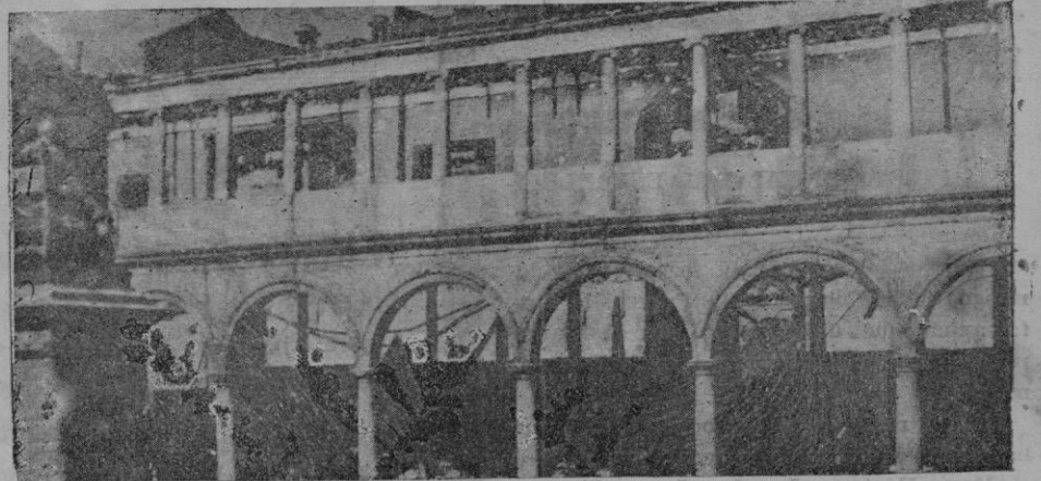
La Universidad que quedó destrozada

A las tres de la madrugada prendieron fuego a mi casa. Yo lo supe antes porque un vecino que habitaba en la planta-baja, y que por su filiación política conocía los propósitos revolucionarios, me lo dijo en un