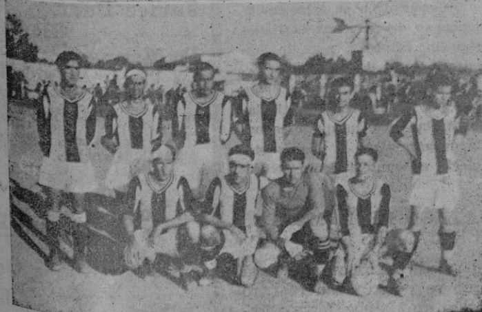
Del partido de fútbol del domingo. — Arriba: el Mediterráneo F. C. que venció al Baleares por 3 a 2 — Abajo: el equipo del Baleares