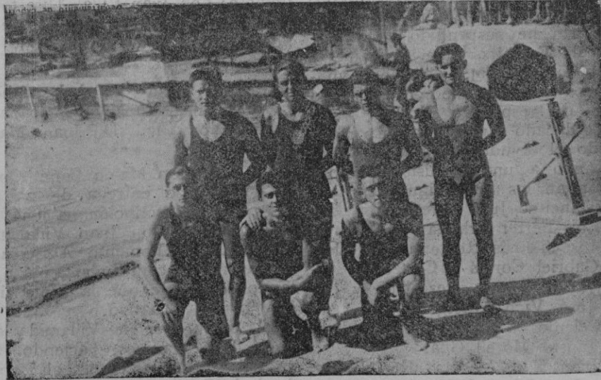
Equipo de segunda categoría del C. Mallorca que quedó campeón el domingo pasado

Refiriéndose a la vuelta al trabajo, dice que no debe haber represalias, pero sí