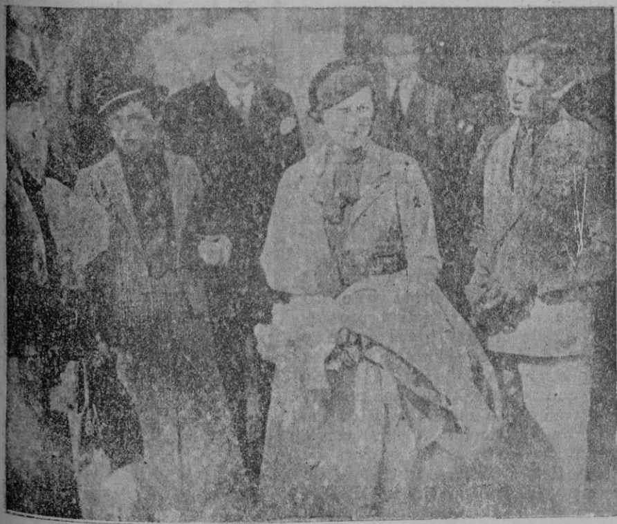
Viena. — El príncipe Jorge (1), hijo menor del Rey de Inglaterra, en su viaje por Austria con su prometida la princesa Marina (2) de Grecia

En escala de itinerario es esperado esta mañana el paquebot francés "Excalibur", procedente de Marsella. Embarcó tres pasajeros y desembarcó seis. Seguidamente salió para Málaga.