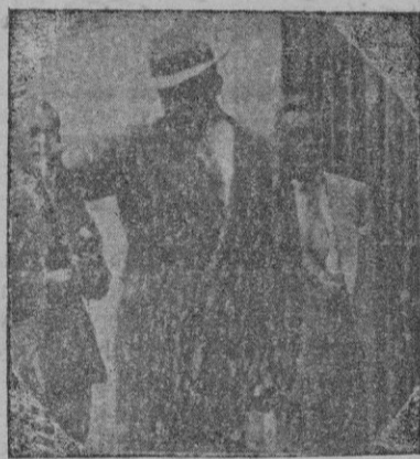
El detective que acompaña al Príncipe de Gales