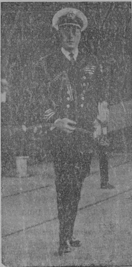
De la visita del Príncipe de Gales a Mallorca. — Uno de los últimos retratos del Príncipe

Solo en un caso nos explicamos el asalto, por la autoridad, a la bolsa del contribuyente; para calmar el hambre de nuestros hermanos; entonces, si que está legitimada la coacción para quien viendo la necesidad apremiante no acude con su óbolo a remediaria. Puede que no esté en la mano de las Autoridades en un momento dado dar trabajo al desocupado, pero autoridad o particular, corporación o sociedad no deben dejar que nadie sienta la desesperación de no tener con que alimentar a los suyos. El pan no debe faltar en ningún hogar.