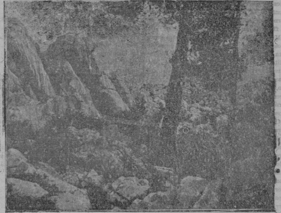
Una de las magníficas vistas del camino de la Calobra con el Puig Mayor al fondo