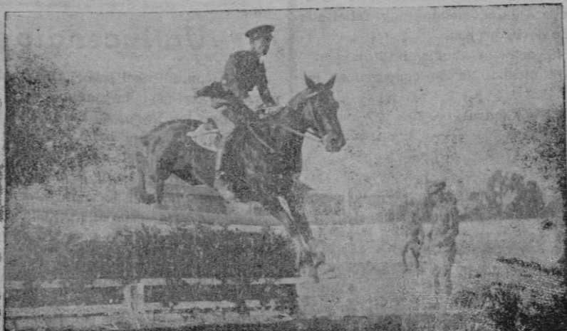
Del concurso hípico celebrado anteayer