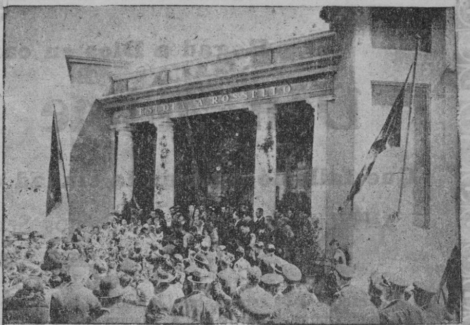
Las nuevas escuelas inauguradas el 14 de Abril.—La escuela de Ses finestres verdes, dedicada a D. Alejandro Rosalló, en el momento de pronunciar un discurso el Gobernador Sr. Manent