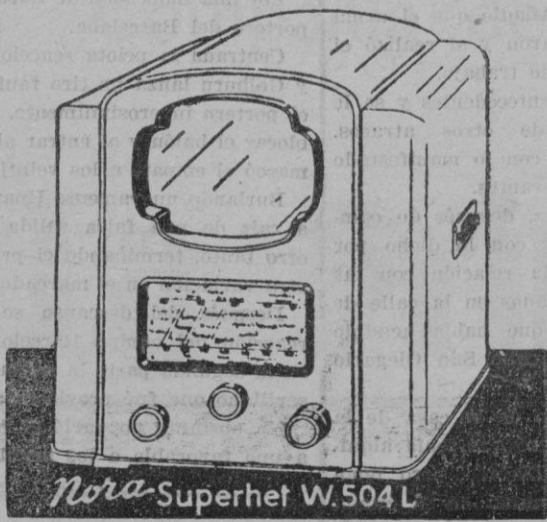
Nora-Superhet W.504 L

LA ESCALA LINEAL DE PLENA VISION ILLUMINADA Y GRADUADA