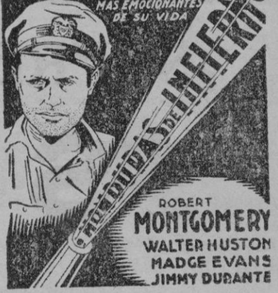
ROBERT MONTGOMERY WALTER HUSTON MADGE EVANS JIMMY DURANTE