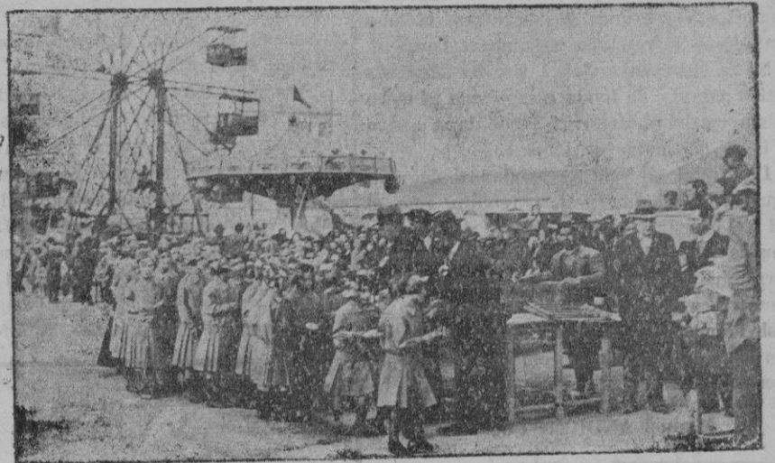
Los empleados del Municipio repartiendo la merienda a las astilladas.