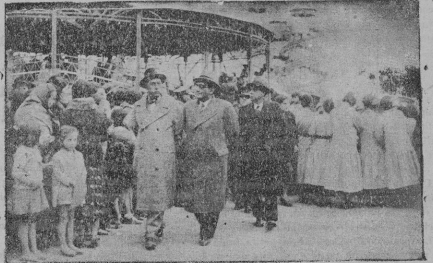
La fiesta infantil en la Feria de Ramos.—El Gobernador con el Alcalde y el representante del Presidente de la Diputación recorriendo la feria.