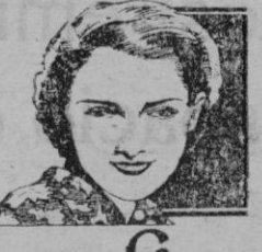
Norma Shearer FREDRIC MARCH - LESLIE HOWARD