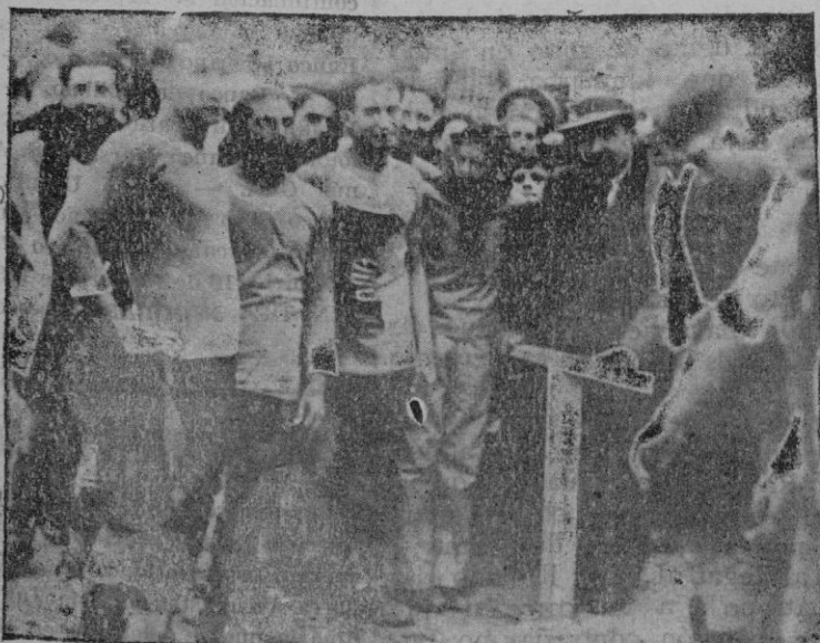
El Presidente de la Federación entregando la copa al capitán del "Baleares" subcampeón de Baleares