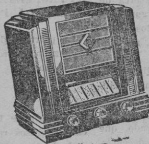
Tipo 330. Ptas. 600--