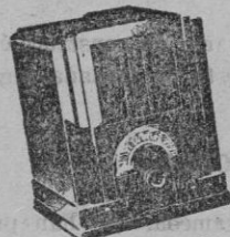
Tipo 125. Ptas. 450--