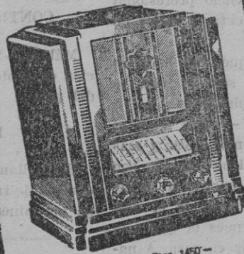
Tipo 653. Ptas. 1450--