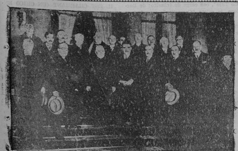
El nuevo gobierno francés.—(De izquierda a derecha, en primer plano): Marin (Higiene), Tardieu (ministro de Estado sin cartera), M. Doumergue, Herriot (ministro de Estado sin cartera), Barthou (Negocios Extranjeros), Marquet (Trabajo), Flandin (O. P.), Sarraut (Interior). En segunda línea: Germain Martin (Hacienda-Presupuesto), Laval (Colonias), Quenille (Agricultura), Piétri (quien está medio escondido Marina de Guerra), mariscal Petain (Guerra), Chéron (Justicia), Aviné Berthod (Educación Nacional), general Devrain, casi tapado por Herriot (Aire), William Bertrand (Marina Mercante), Rivollet (Pensiones), Mallarmé (Correos y Telégrafos), y Lamoignon (Comercio)

La invitación es clara y concreta. Su alcance todavía las ennoblece y acrecienta