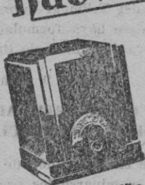
Tipo 125. Ptas. 450--