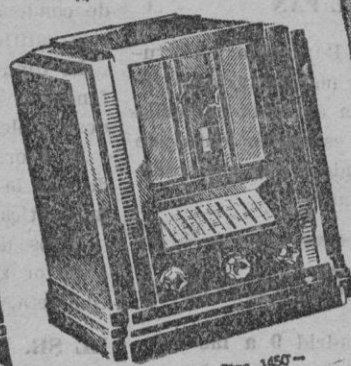
Tipo 653. Ptas. 1450--