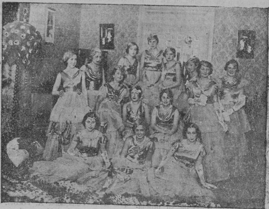
Grupo de distinguidas señoritas que en traje de tono azul, fué una de las comparsas más notables que acudieron al baile de la sociedad "Lawn-tennis" celebrado en el Teatro Principal