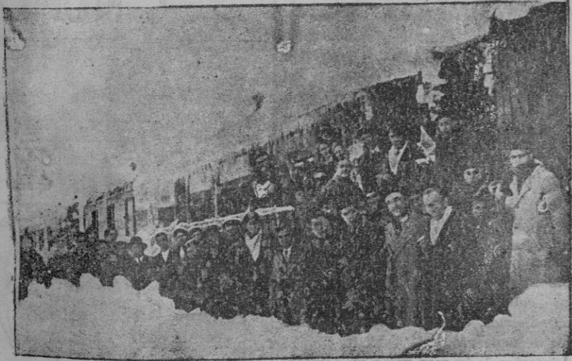
No nos quejemos del frío. Mayor motivo tienen esos pasajeros del tren Santander-Madrid, que estuvieron tres días bloqueados por la nieve en el Puerto de Pajares