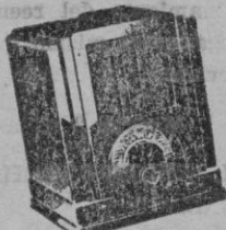
Tipo 125. Ptas. 450-