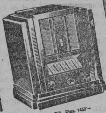
Tipo 653. Ptas. 1450-