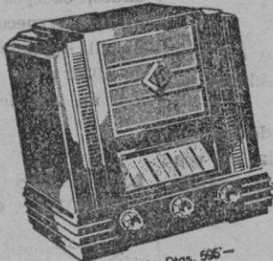
Tipo 330. Ptas. 550-