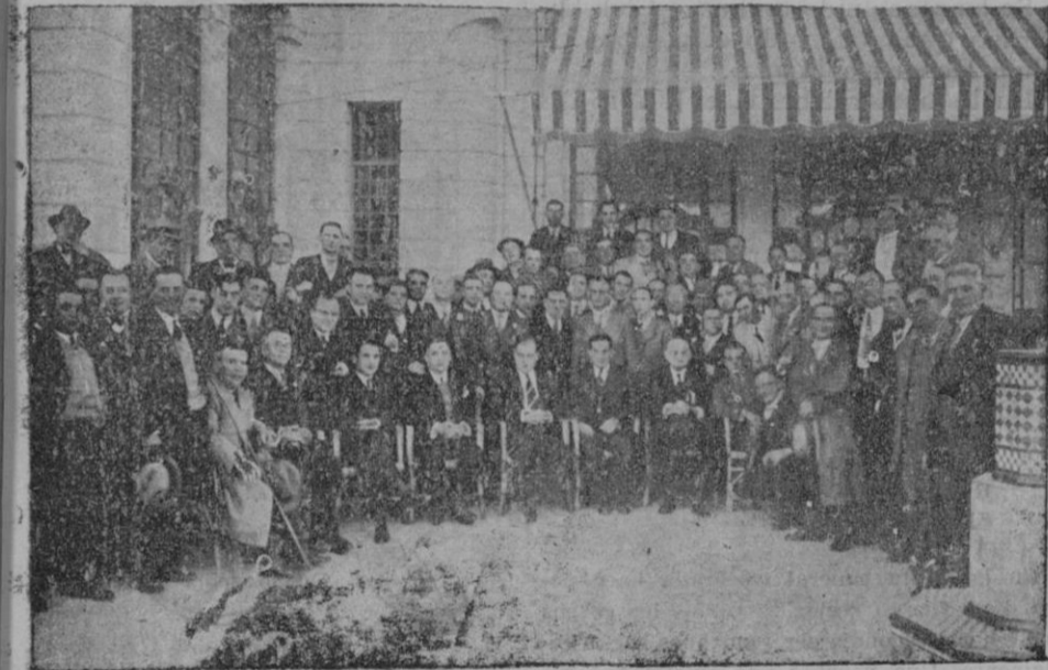
Banquete homenaje ofrecido al Comité de la Hípica de Mallorca por la naciente Sociedad "Fomento al Caballo" en prueba de adhesión y simpatía inquebrantables

Además, el señor Herrera dará otra conferencia para los Reverendos señores Sacerdotes y seminaristas, el martes, a las once, en el Seminario.