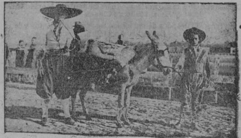
Dos cabalgaduras que figuraron en la cabalgata del día de San Antonio