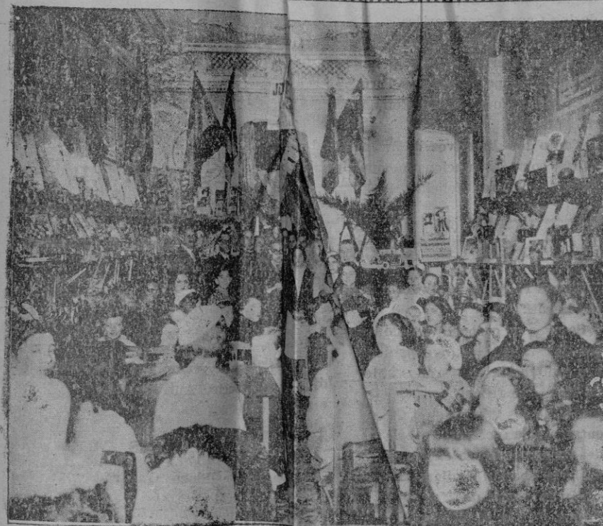
Fiesta celebrada por la Juventud Ateneista en obsequio de los niños de sus socios que regalaron juguetes para los asilados.