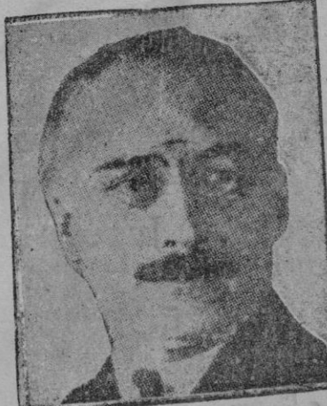
El presidente rumano asesinado, señor Duca

Según nos explican las noticias radiotelegráficas, la prensa inglesa ha publicado exhibiciones que han tenido a bien dar, de deformidades fisiológicas, unos entes monstruosos, en el estuario holandés y en las costas escocesas. Cosa lógica es que en la Gran Bretaña los grandes acontecimientos sucedan en el mar, como sería lo propio que en el mar sucedieran en las Selvas y en África, en el desierto; aspectos de la naturaleza que son los que más abundan en tales regiones y que permanecen en gran parte tan desconocidas