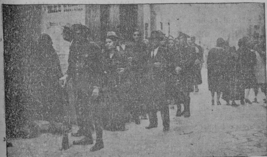
Las colas en las elecciones en Palma

—Se habrán referido a unas gestiones que he realizado por iniciativa particular cerca de los señores Azaña y Besteiro para buscar una unión en la lucha electoral de toda España en aquellos distritos en que precise una segunda vuelta, pues se dá el caso de que el total de votos de los grupos republicanos en distintas provincias donde han triunfado las derechas, se observa que son muchos más que los que han conseguido estas últimas.