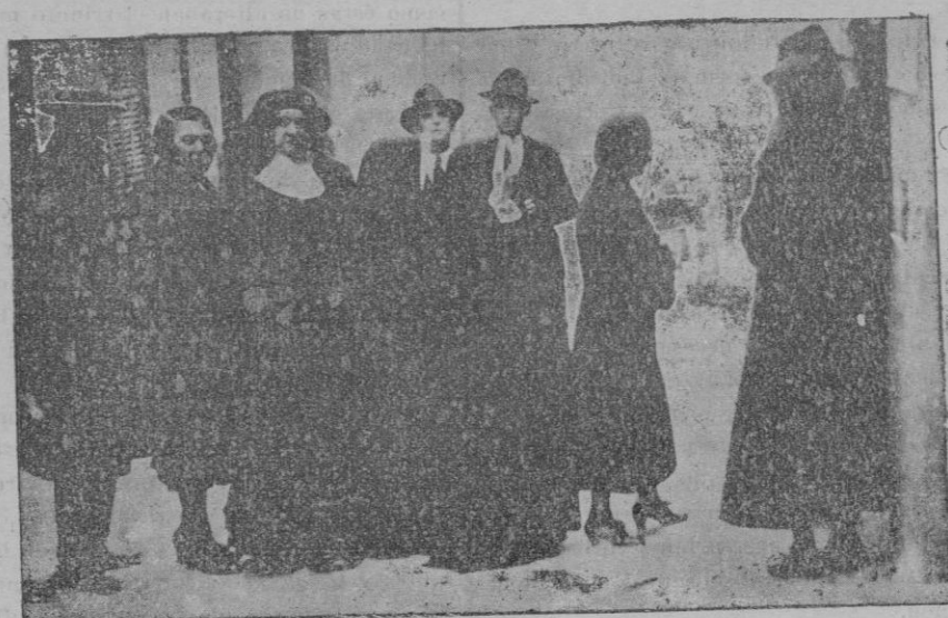
Religiosas formando en la cola del colegio de Santa Fe