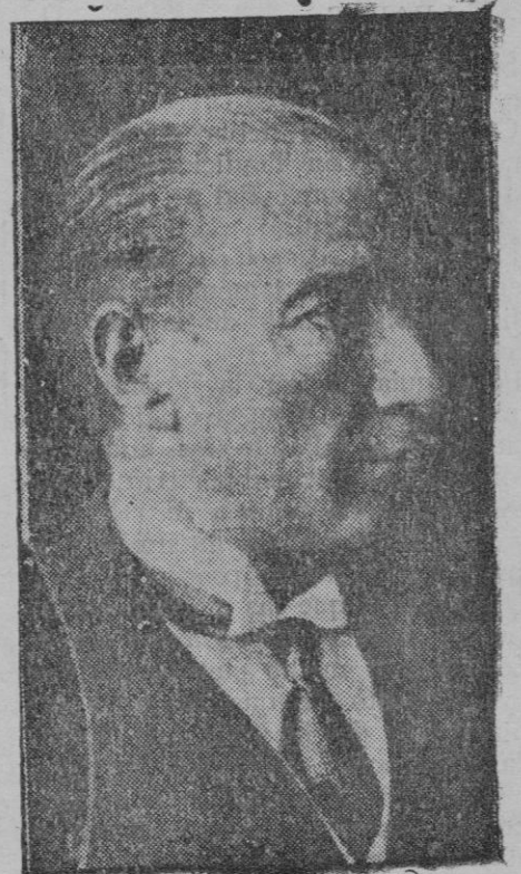
El Presidente de la República turca Mustafa Kemal, que ha sido muy felicitado por cumplir el décimo aniversario de la proclamación de la república