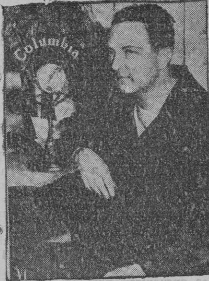
El almirante Byrd a punto de emprender su segunda expedición al Polo Sur, dirigiendo la palabra al público por radio