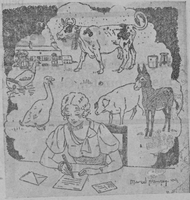
“Nuestros queridos amigos: En la granja donde vivimos hay ininidad de vacas, de gallinas, de patos, de cerdos y de asnos. No tengo que decirles que nos acordamos mucho de ustedes.”