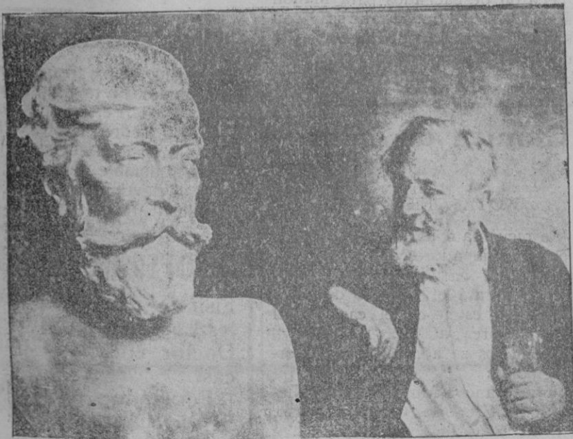
El busto en mármol de Santiago Rusiñol, obra del ilustre escultor don Enrique Clarasó, que será colocado en la Avenida de Santiago Rusiñol, del Parque de Montjuich

Darrera el portal, podia esguardar-s'hi a un costat el gegant Briareus o Egeus, deu marí, fill de Tità i de la Terra, de musculatura hereúlia i força extraordinària, de cinquanta caps i cent braços en actitud de bran-