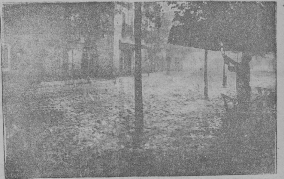
Momento en que descargaba la granizada del jueves en Palma

El carácter que predomina en el nuevo Gobierno suscita fundadísimo temor de que se intente anular la legislación social, no sólo mediante leyes derogativas, sino apelando al