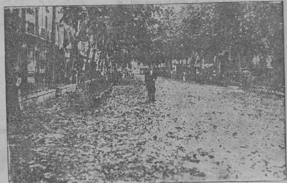
Aspecto que ofrecía el Paseo del Borne, cubierto por el granizo y las hojas arrancadas por la tormenta