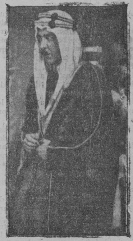
En Berna, donde atendía a su quebrantada salud, ha muerto el rey Feysal, de Hedjaz