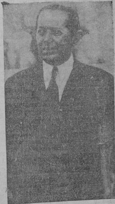
El famoso ex-matador de toros Antonio Fuentes a los 64 años en la placita de La Pañoleta, en Sevilla, ha toreado y matado soberbiamente un novillo

Para dicha excursión reñra gran entusiasmo, esperándose revestirá un verdadero éxito.