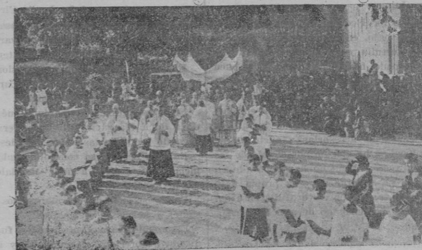
Desfile de la procesión por los recintos del Monasterio

custodia predicando el Superior del Monasterio adecuado sermón de súplicas al Santísimo Sacramento, que el público contestaba con gran emoción.