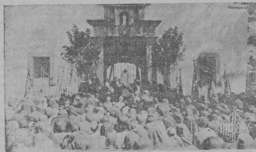
El Ilmo. Obispo de Huesca en el momento de celebrar misa, en el altar improvisado en la puerta del Monasterio, con motivo del II Centenario de la Gran promesa del Corazón de Jesús

Más de 70, en todos los actos, dieron nota de gran compostura al par que una gran sencillez.