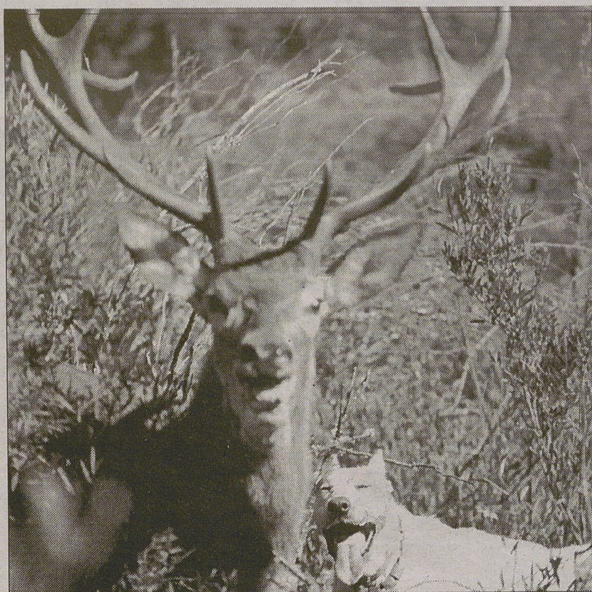
El calor impidió al igual que en otras fincas mejores resultados.