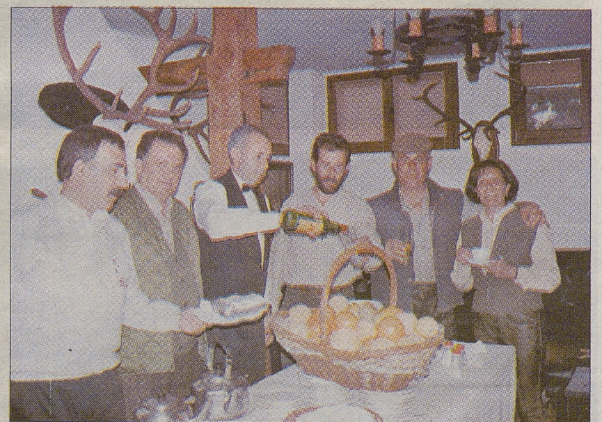
El Restaurante El Coto de Almuradiel, sirvió la excelente comida de montería.

No olvidar sacar un buen vino tinto de las bodegas de Valdepeñas que tiene el Marqués de Luparia, y con regusto por el buen guisar de las mujeres y hombres de nuestras tierras Manchegas, llenar la panza de buen guiso de gamo, el que me contó la receta un amigo de caza.