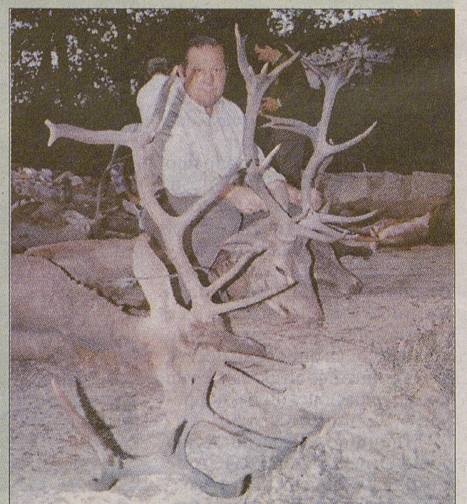
Buenos trofeos se cobraron en la Finca "El Tagarillar".