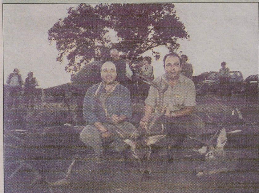
En la finca El Campillo la cantidad y la calidad triunfó.

Nuestra enhorabuena por la buena montería así como por los cuidados que refleja la finca.