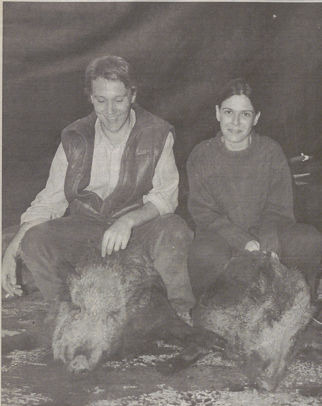
Los Jabalíes hogaño están dando buenas jornadas de caza.