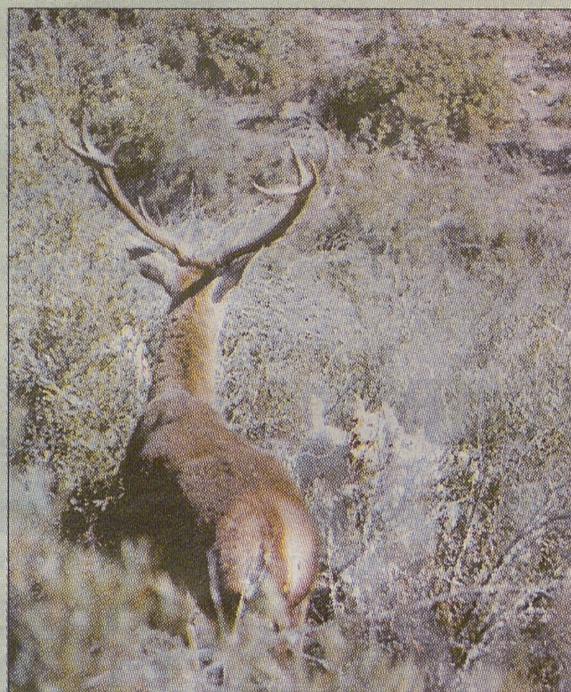
El exceso de calor, perjudicó a la montería.