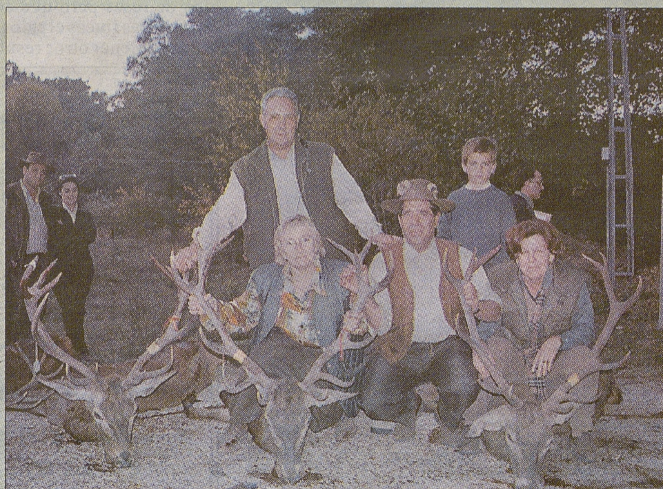
En el Hotel Los Azores de Fuencaliente, se expusieron todas las reses abatidas.