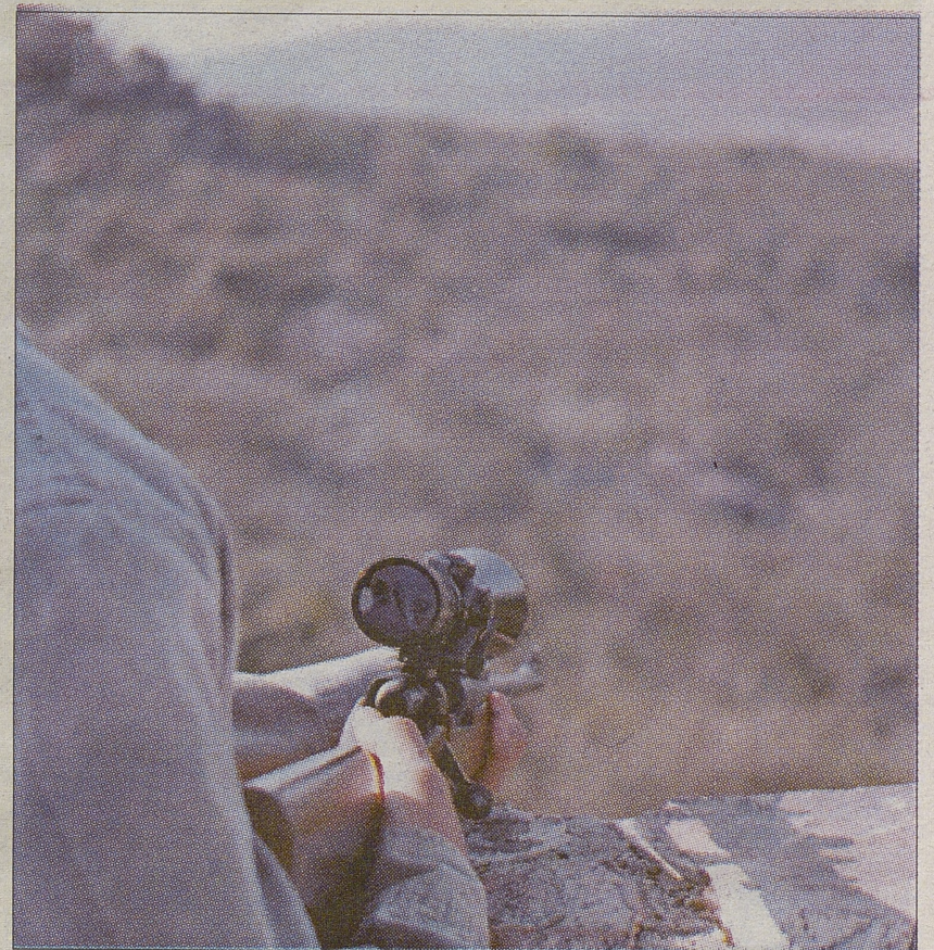
Las utilidades del visor; apuntar para disparar única y exclusivamente.

Reflexione y, por favor, no lo vuelva a hacer jamás.