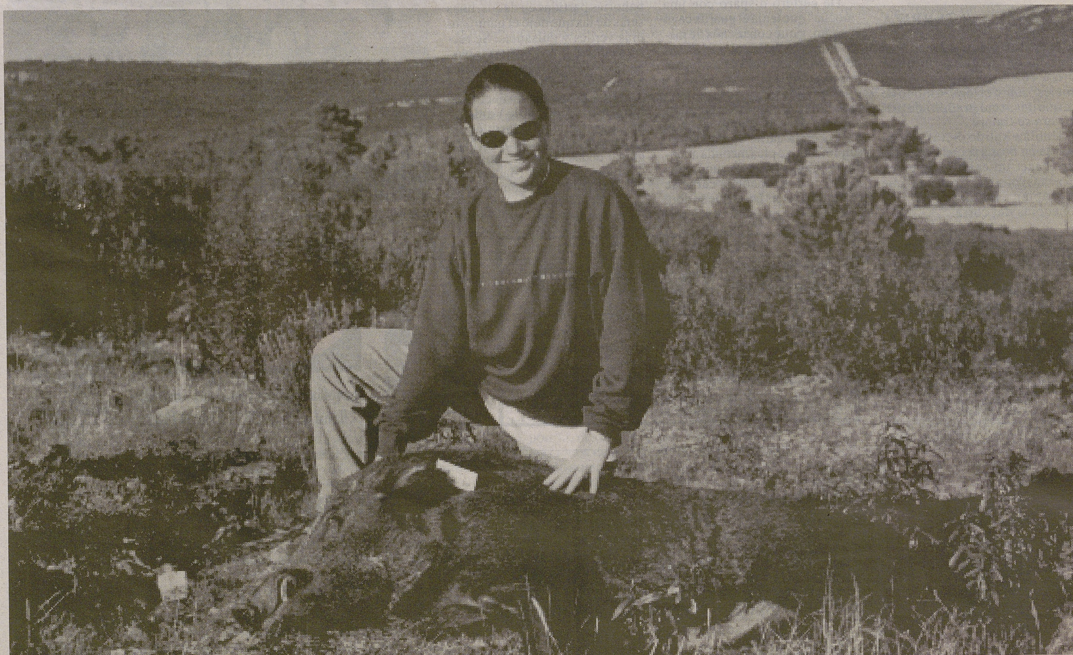
Jabalíes abatidos en la provincia de Guadalajara.