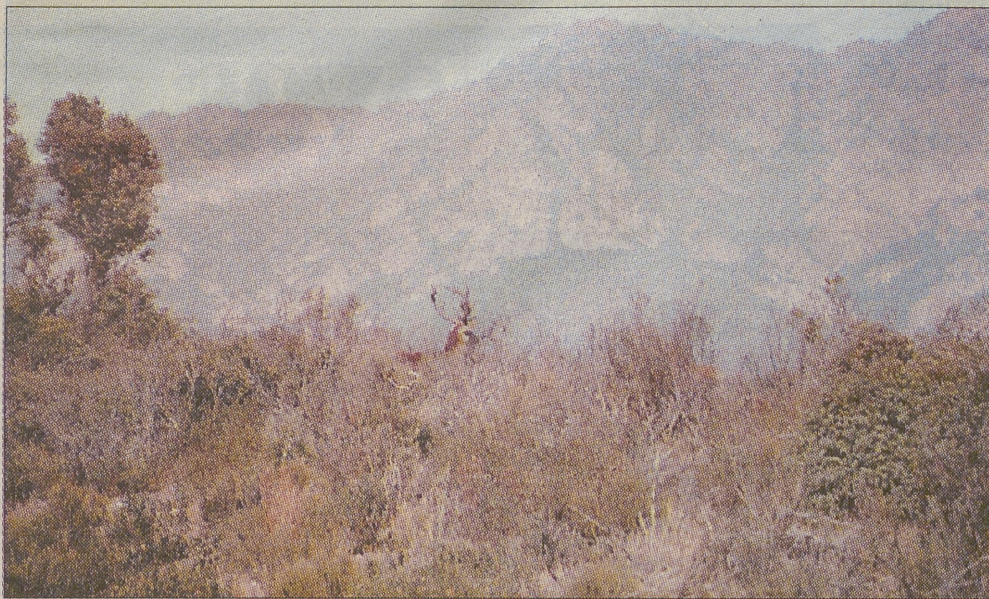
Sierra Madrona al fondo. Delante en el viso, los ciervos corrían hacia los barrancos.

R.T. Cada vez que saltamos las cuerdas del Valle de Alcudia y entramos en Sierra Madrona, nos invade la emoción y el sentimiento de estar en los grandes bosques que una vez perdimos en Castilla. En Fuencaliente estas Sierras de alta alcornia habitadas con machos monteses, barrancos donde se encaman los cochinos y valles y laderas donde el rey del bosque se encumbra al pintar el alba, y los bosquecillos de milflores con suelos alfombrados cubren de rocío, grises lomos de corzos inmóviles.