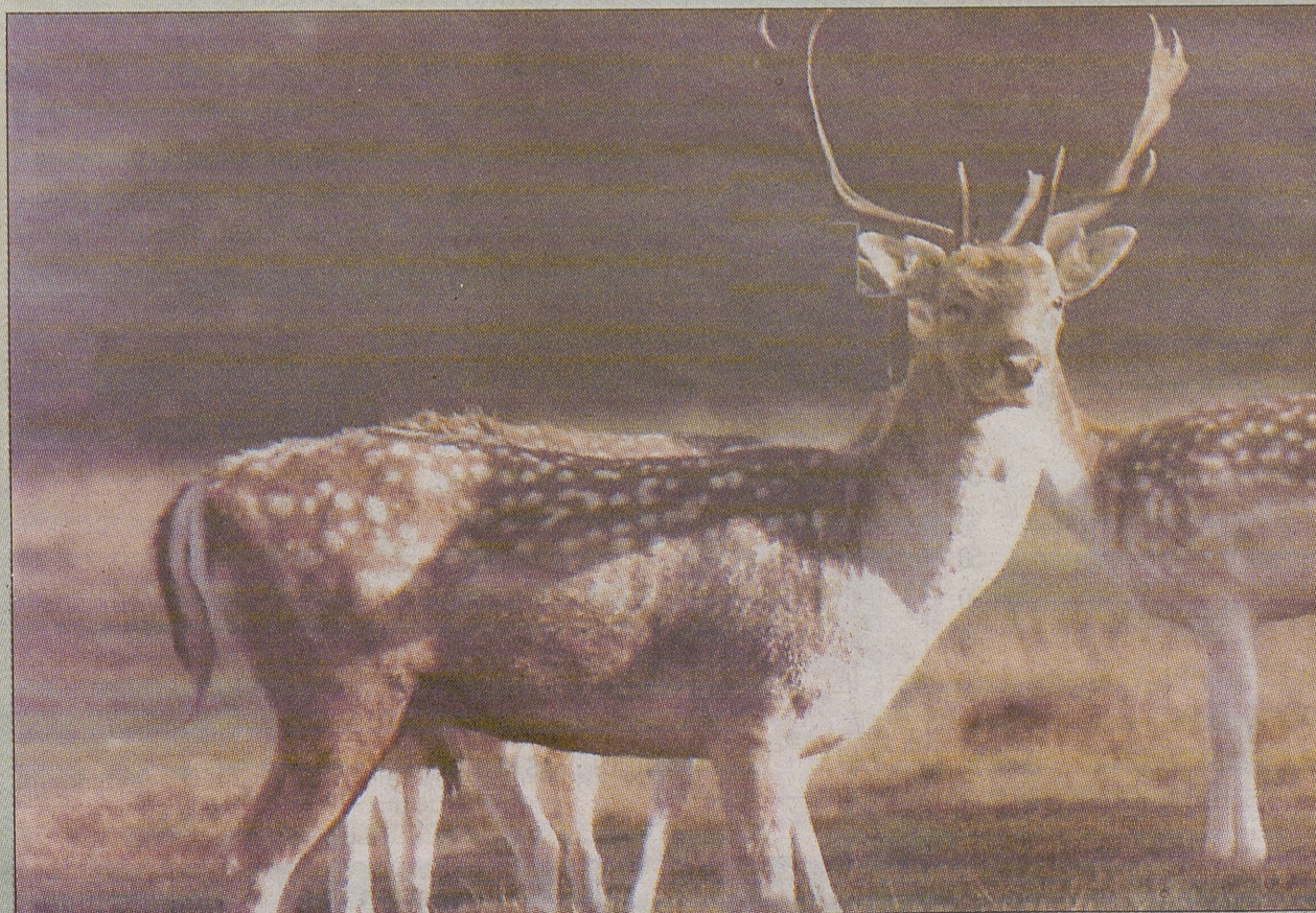
El Gamo ( Dama dama ) magnífica foto de la colección Fauna Iberica donde se refleja la belleza del Gamo.

Es un animal de costumbres diurnas y es fácil localizarlos cerca de las praderas donde comen pues solo se adentran en el monte para protegerse en caso de huida. Las estampidas se producen a raíz de una simple alarma que pueda propiciar alguna hembra normalmente, las que con la cola indican el nivel de peligro.