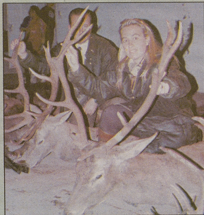
Hubo buenos venados, excelentes muflones y mejores jabalíes.