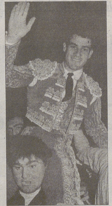
Miguel Báez "el Litri".

mostrándose voluntarioso pero sin hacerse con su enemigo, el quinto no tenía un pase y estuvo breve. Lo más destacado corrió a cargo de Abellán, con tres chicuelinas muy ajustadas.