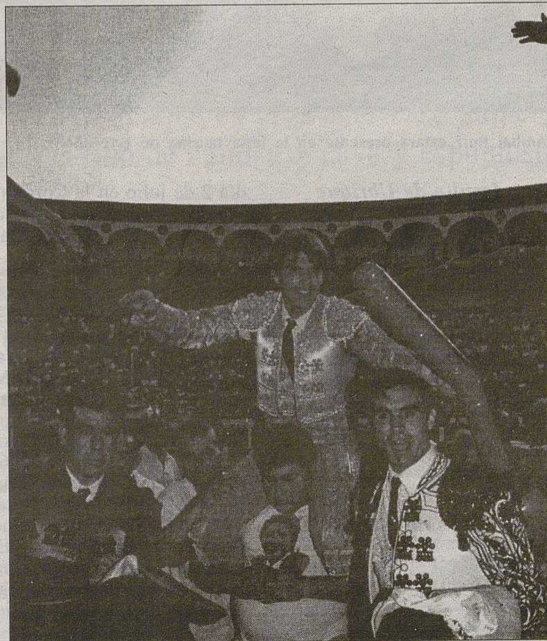
Manuel Díaz "el Cordobés" triunfó en Pontevedra.

El diestro Manuel Díaz «El Cordobés» cortó dos orejas y salió a hombros en la corrida celebrada el domingo en Pontevedra, en la que César Rincón y Eugenio de Mora también lograron un trofeo cada uno.