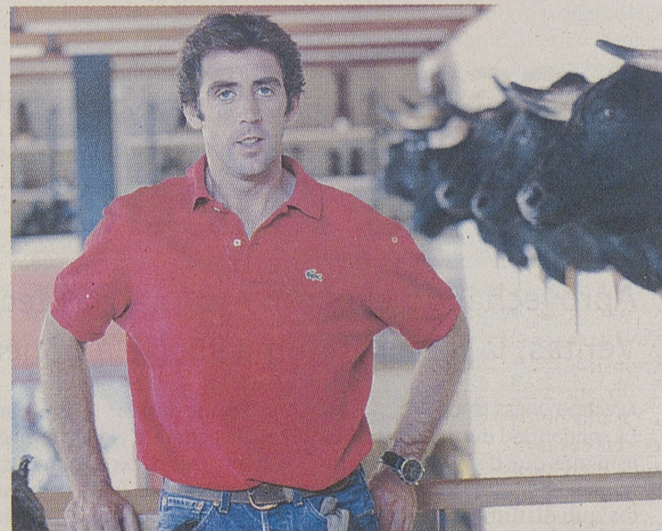
Hermoso de Mendoza pasará las navidades toreando en tierras mexicanas.