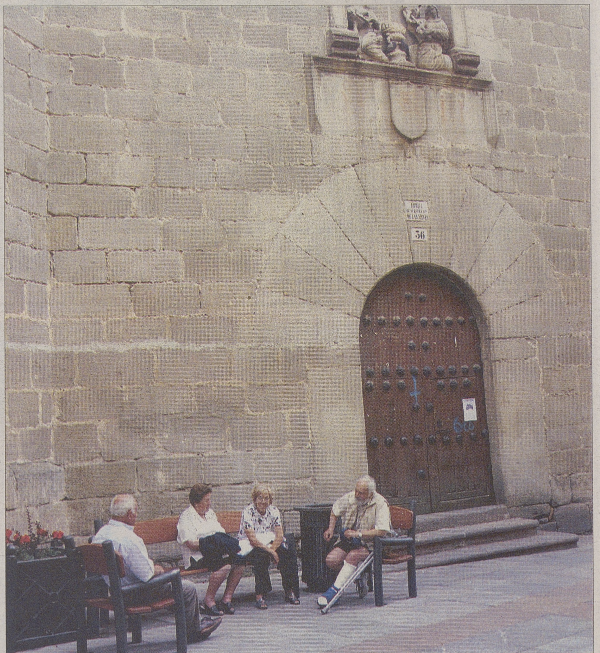
Fachada principal de la capilla de la Virgen de las Nieves, en la calle Reyes Católicos.

A pesar de la dificultad de separar los estilos de ambos artistas, Parrado del Olmo se inclina en esta obra por la autoría de Lucas Giraldo, al encontrar «una mayor sequedad expresiva con respecto al dulce idealismo que suele aparecer en Juan Rodríguez. Y sobre todo, por utilizar unos paños que siguen una técnica que recuerda la de Damián Forment, en cuyo taller se sabe que estuvo trabajando Giraldo antes de pasar a vivir a Ávila».