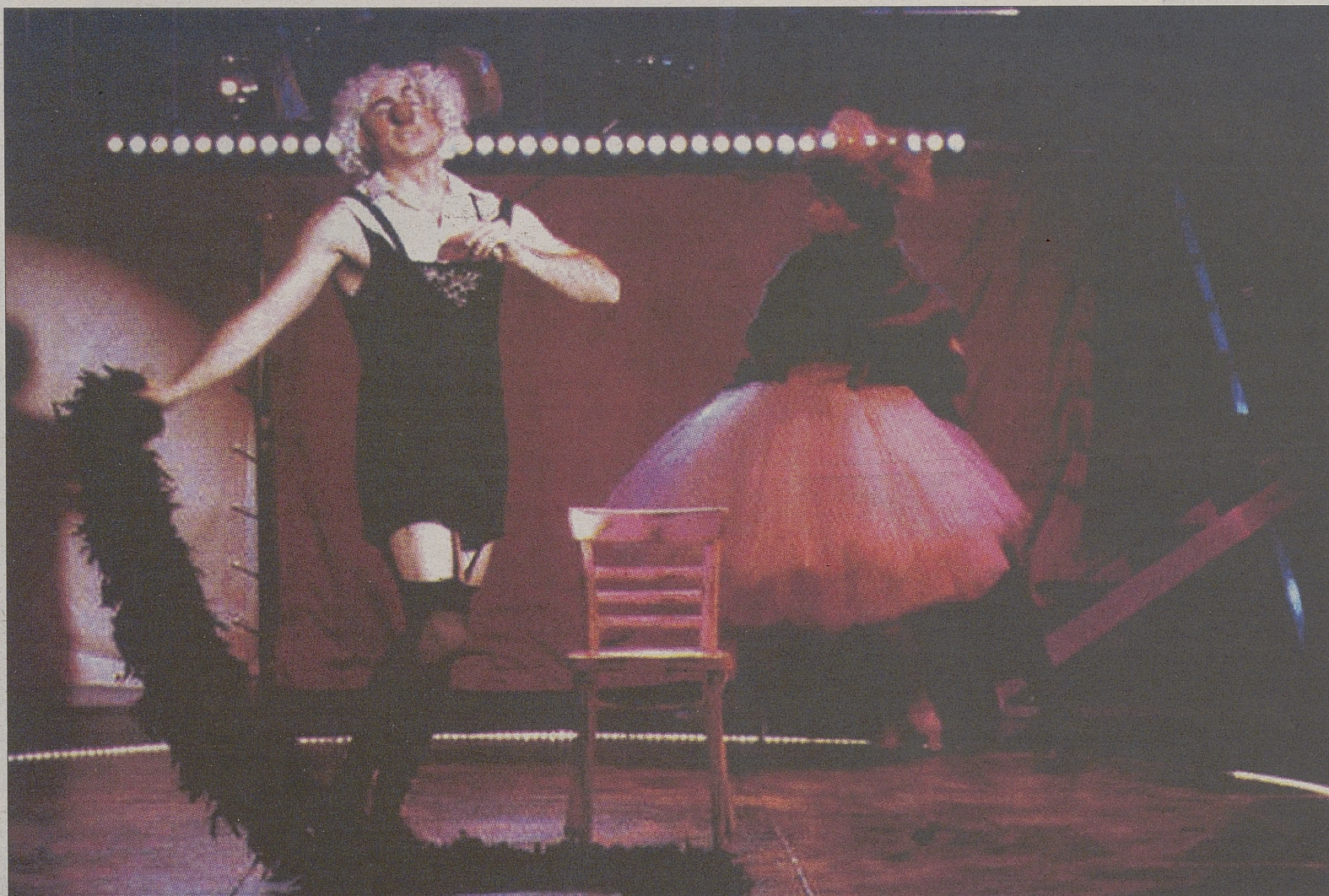
Instantánea de la representación de 'Sobre Horacios y Curiaños' de Bertolt Brecht.