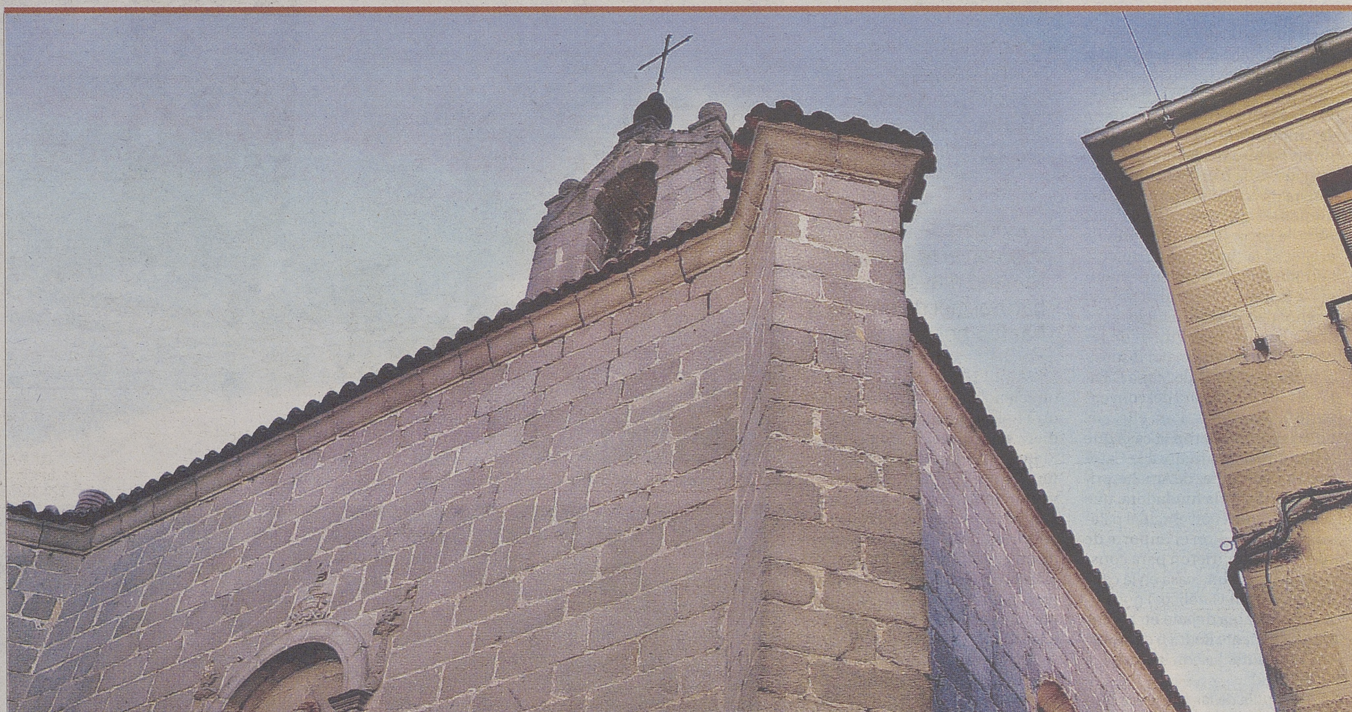
Fachada norte de la capilla de la Virgen de las Nieves, en la calle Reyes Católicos.

750.124 personas visitaron 'Testigos' durante las veintiocho primeras semanas