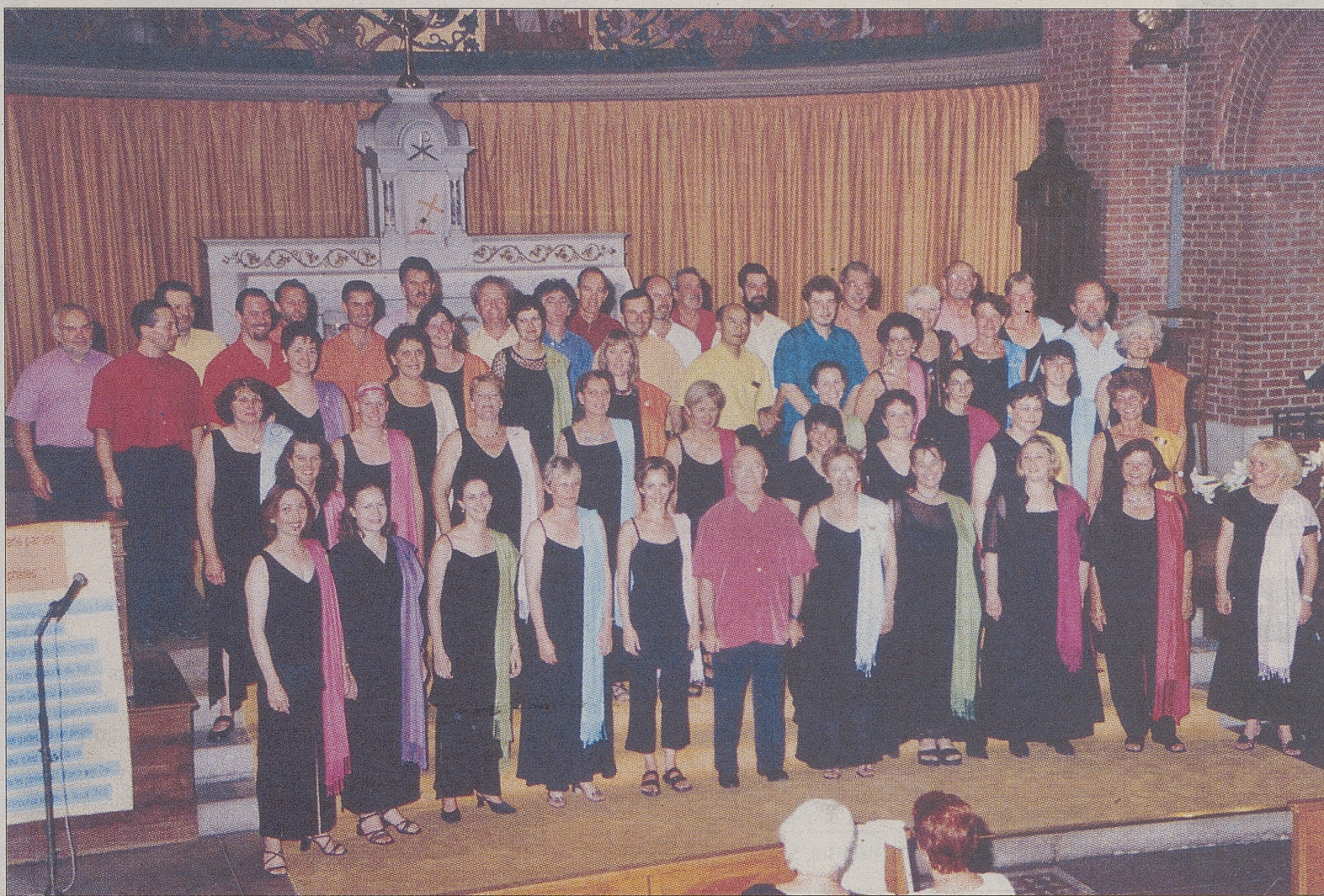
Componentes del grupo Miton Gospel Singers, de Villeneuve-sur-Lot.