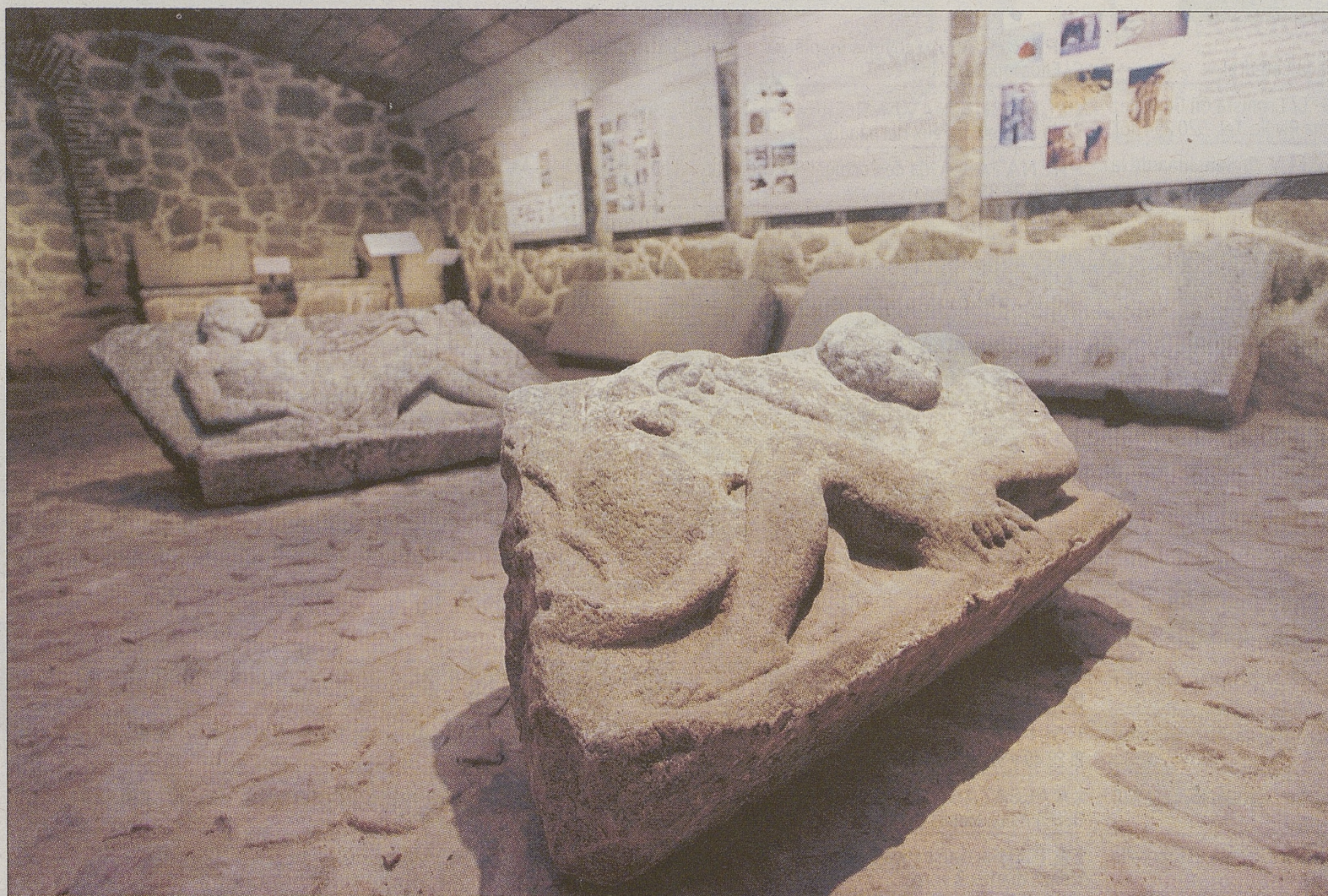
Piezas de la exposición 'Ávila, piedra sobre piedra'.