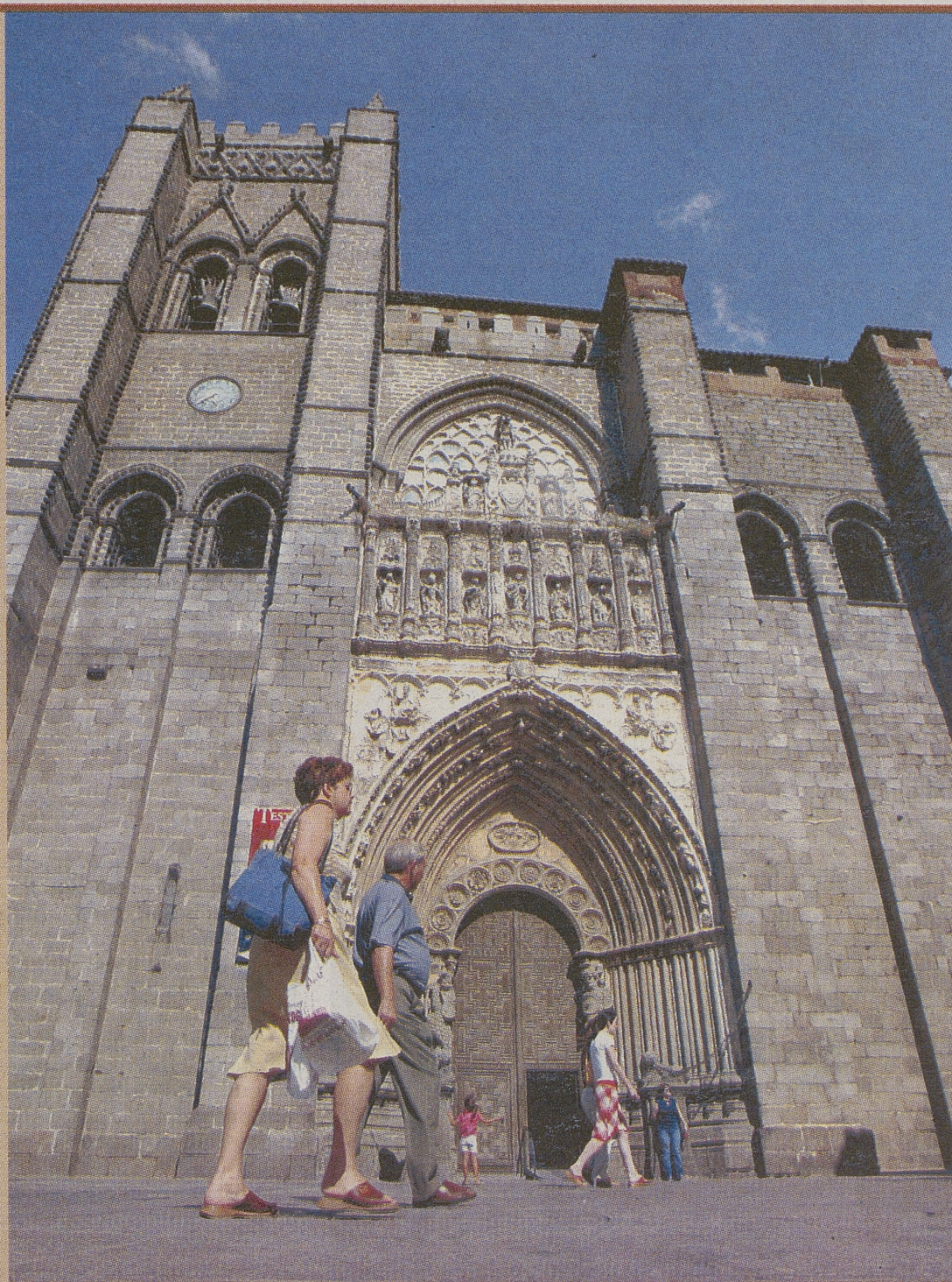
Visitantes a la exposición de 'Testigos' pasean por los alrededores de la catedral.

personas visitaron 'Testigos' durante las trece primeras semanas