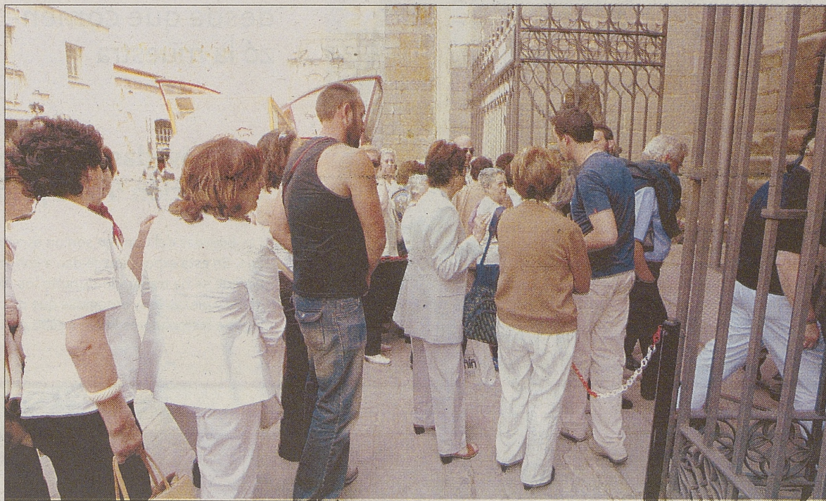
Visitantes hacen cola para entrar a ver la exposición.

La exposición de 'Testigos' no cree en las supersticiones y pese a ser su semana número 13, ha registrado el mayor número de visitantes desde que la muestra abriera sus puertas. Así pues, 26.812 personas accedieron al interior de la catedral abulense y disfrutaron de las innumerables obras sacras de 'Testigos'. Una semana en la que se estrenó el nuevo horario de apertura al público. Desde el pasado lunes 26 y durante todos los lunes del mes de agosto la muestra abrirá desde las diez de la mañana hasta las ocho de la tarde de forma ininterrumpida. Un nuevo horario más flexible que, junto a las vacaciones veraniegas de las que muchas personas disfrutaban, permitirá visitar la exposición durante todos los días de la semana y se mantendrá hasta el 1 de septiembre en que se volverá al que ha venido rigiendo hasta ahora. Un motivo por el que pese a batir récord de afluencia, la exposición no ha conseguido superar la media de las semanas anteriores. Así también la media diaria sufre un leve descenso, si la comparamos con la de la semana anterior. 3.830 personas visitaron diariamente la exposición durante la décimo tercera semana, 150 visitas menos que la anterior.