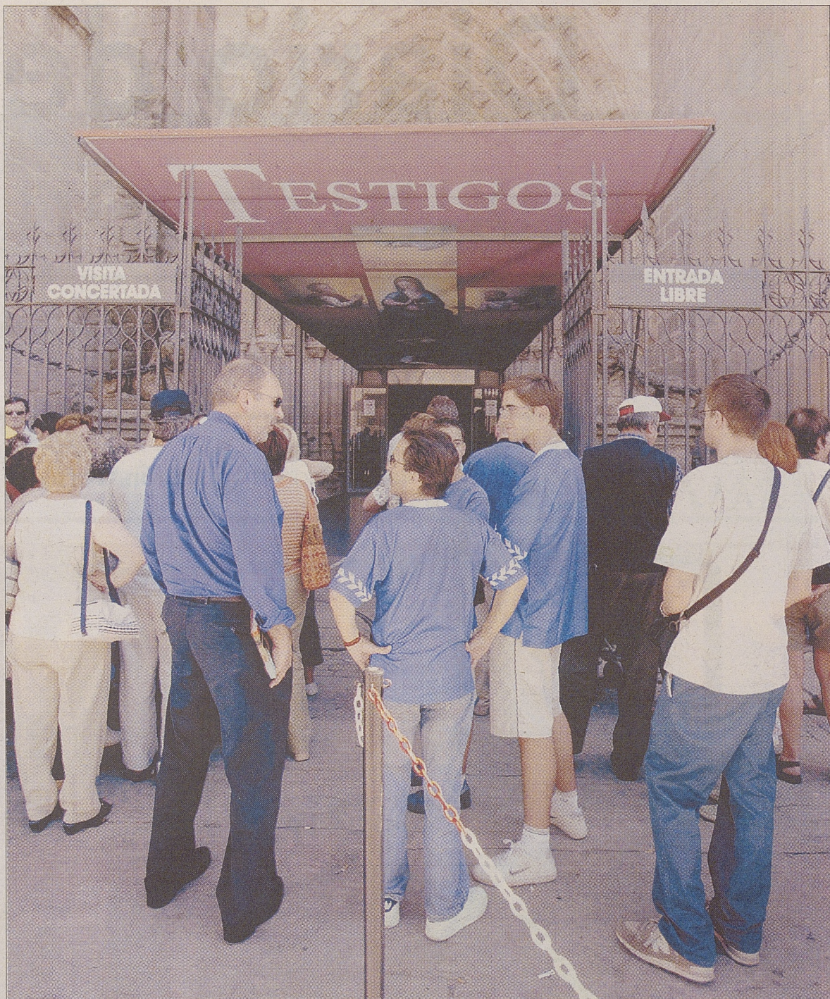
La media diaria de visitantes durante la octava semana de 'Testigos' fue de 4.249 personas.