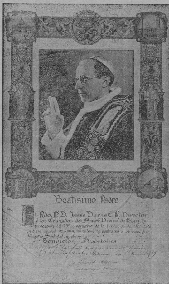
Fotocopia de la Bendición que Su Santidad el Papa Pío XII se ha dignado enviar a la Cruzada del Amor Divino en el XXV aniversario de su fundación