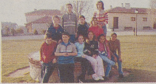
►C. P. EL ZAIRE / BURGOHONDO «La Abadía»

Cuando vas al castillo con alguien que conoce la historia te dirá: «Acércate a la piedra y oirás cantar a la moza». Pero, cuando vas y pones la oreja, la persona que te acompaña, te empuja y te da contra la piedra; y como algunos, a veces lloran por el golpe, te dicen: «¿ves como canta la moza?».