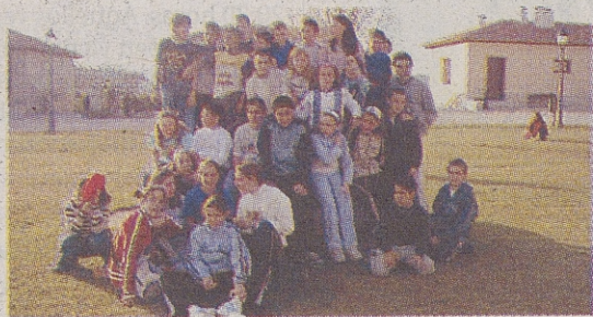
►C. P. VILLA DE LA ADRADA / LA ADRADA «Broma de la moza»

En el castillo de nuestro pueblo, que dentro de poco será abierto al público, había una piedra que dicen que tiene forma de mujer y se dice que si te acercas se la oye cantar lastimeramente.