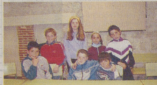
►C. R. A. SANTA TERESA / FLORES DE ÁVILA ►C. R. A. LLANOS DE MORANA / VITA «Leyenda de La Atalaya»

En la abadía, por debajo del suelo, hay muchas tumbas de los antiguos monjes; también podemos destacar el claustro, donde se reunían los frailes, y el coro. En la actualidad, se han efectuado reformas y está en mejores condiciones. Si pasáis por Burgohondo, preguntad por la abadía que es muy bonita.