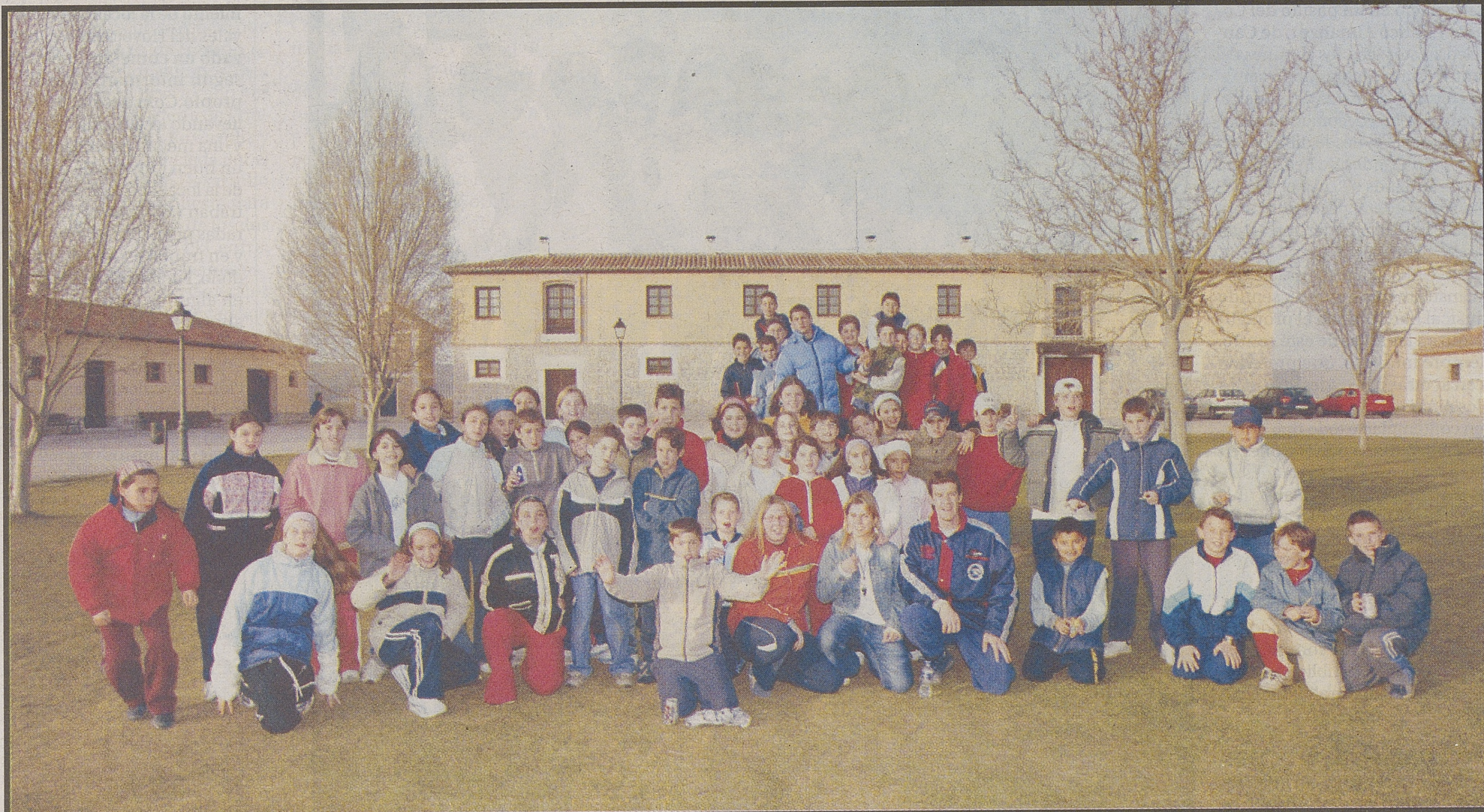
Alumnos del colegio Villa de La Adrada (La Adrada), del colegio El Zaire (Burgohondo), del colegio Moreno Espinosa (Cebreros) y de los CRA Santa Teresa (Flores de Ávila) y LLanos de la Moraña (Vita)