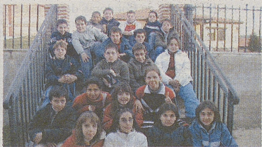
►ALUMNOS SEXTO DE PRIMARIA / EL HOYO DE PINARES