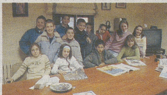
►C.R.A. NAVAS DEL ALBERCHE / SAN JUAN DE LA NAVA

Hacia ese año, las jóvenes del pueblo introdujeron una «atrevida» moda, que consistió en adornar con bolsillos sus delantales, adorno del que carecían hasta entonces. Ello originó cierto entusiasmo, mezclado con cuchufletas, inventándose canciones alusivas al «avance» experimentado en el arte de vestir, y que las jóvenes a coro, cantaban por las calles. La coplilla decía así: «El Hoyo ya no es El Hoyo, que es un segundo Madrid; ¿cuándo se han visto en El Hoyo, bolsillos en el mandil?».