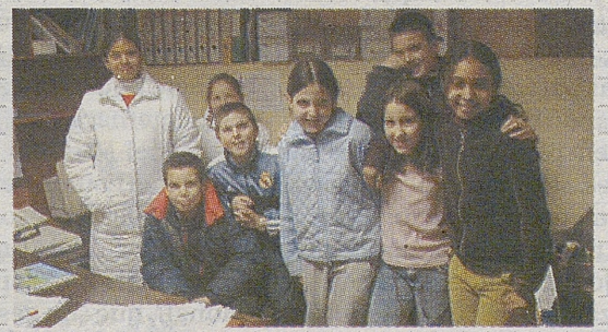
►C.R.A. NAVAS DEL ALBERCHE / SAN JUAN DE LA NAVA

En la localidad de San Juan de la Nava, el Rollo jurisdiccional, está emplazado en la Plaza de San Sebastián donde había una ermita bajo la advocación de este santo.