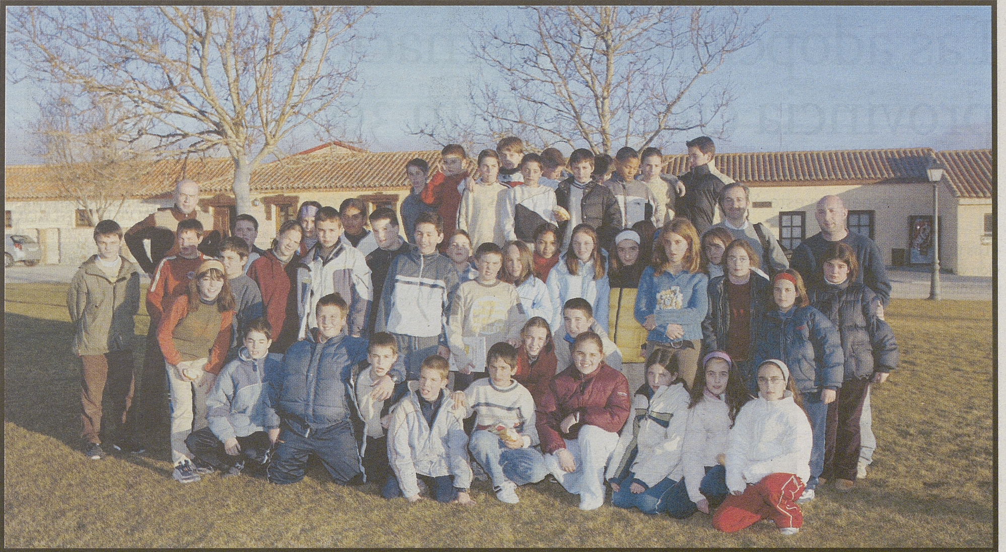
Alumnos de El Hoyo de Pinares (sexto curso de Primaria) y del CRA Navas del Alberche.