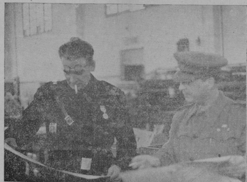
El Administrador General de la Prensa del Movimiento, y el Director de “FALANGE”, miran los primeros números de nuestra edición salidos de la máquina.