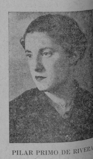
PILAR PRIMO DE RIVERA

Washington.—Continúa la terrible campaña desencadenada por algunos senadores en contra de Estados Unidos se conviertan en los almacenes de material de guerra de Inglaterra y Francia.