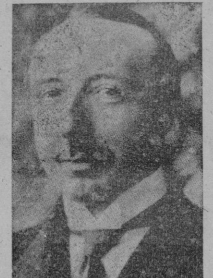
Mr. León Berard que ha llevado a feliz término las negociaciones encaminadas al reconocimiento de la España Nacional por parte de Francia, y uno de los que se dan como probables embajadores

Los círculos comunistas dicen parecer los compromisos que se hiciera con cierto país no son más que pel mojados. Aparte de esto, de vista de los círculos políticos allegados al Quay D'rosay que satisfacción que el gobierno Daladier ya conseguido vencer las dificultades de política interior que se oponen al reconocimiento de jure. Al mismo tiempo los círculos del Quay D'rosay man que si el gobierno de Daladier, Francia continuará resolviendo de facto. A consecuencia del reconocimiento de jure del gobierno Franco por Francia se deberá el actual embajador francés en el gobierno de Madrid pero dejará de ser el encargado de negocios para ser el representante de Francia en el reconocimiento de facto.