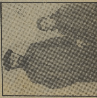
El filme de Víctor Erice, «El Sur», en «De película»