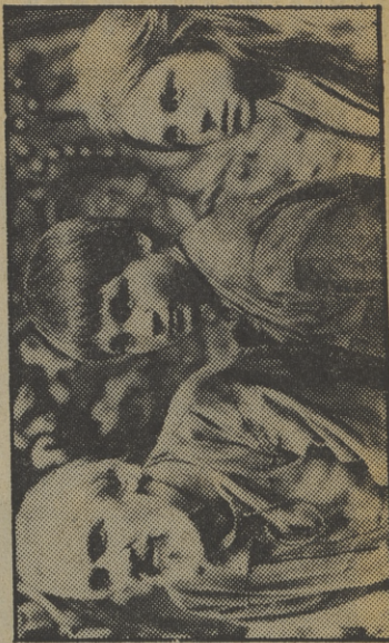
«Bajo la montaña»