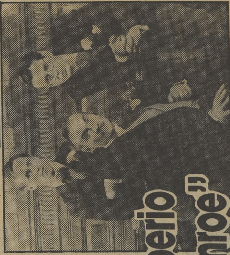
«El imperio de Munroe»