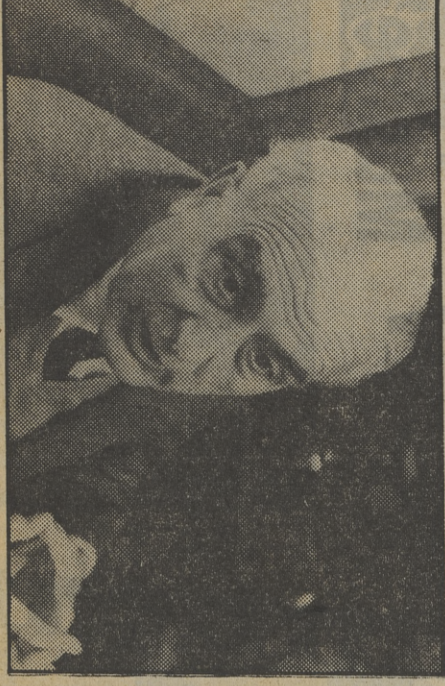
El Defensor del Pueblo, en «Usted, por ejemplo»