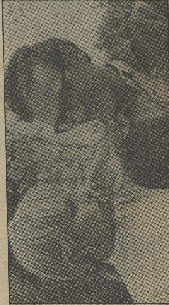
La «ex» de Saura, Geraldine Chaplin, es la protagonista de «Los ojos vendados»