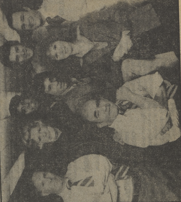
Todo el equipo de Redacción, incluido «el animal»