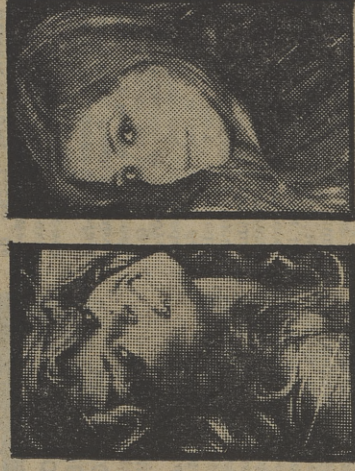
Farrah Fawcett en «Asesinato en Texas»