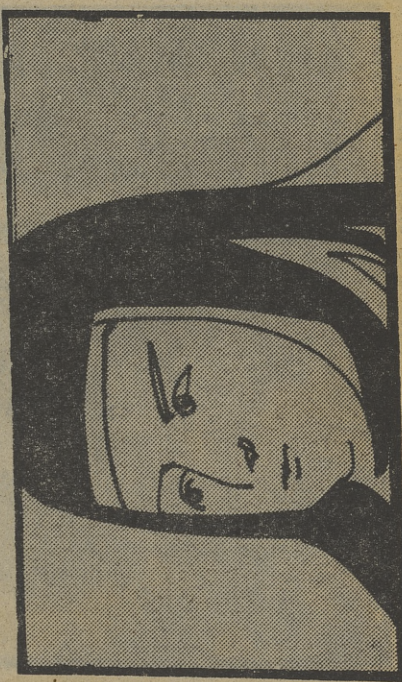
«CAVILA DE SANTA TERESA»