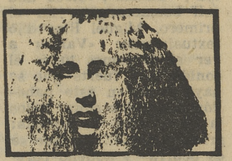
Sonamos ver a ALASKA en plan menina

MALONE o LA DECIMA VICTIMA, GLUTAMATO YE-YE sueña con montarse su propio sello discográfico. Las efemés se esfuerzan en rentabilizar a tope su negocio y se dedican a anunciarnos los mil mejores cada día, sin entender nadie muy bien por qué el primero y por qué el de mil, pasando por los estados intermedios. LOS ANTIFACES se disfrazan cada vez que salen a escena y descuelgan el propio disfraz cuando llegan, noctámbulos y temerosos, a la casa paterna de puntillas. PARALISIS PERMANENTE abandona el rótulo que los anuncia y se lanzan